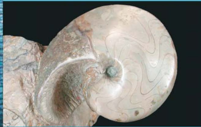
Nautilus sp., Kopffüßer, Smlg. W. Kerndler