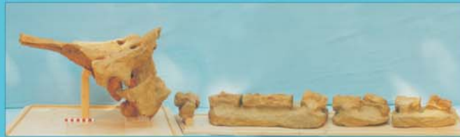
Placoziphius duboisi , Zwergpottwal, Smlg. G. Wanzenböck

Auch Mineralogen an Museen und Universitäten können auf die Sammeltätigkeit von Privatsammlern nicht verzichten.