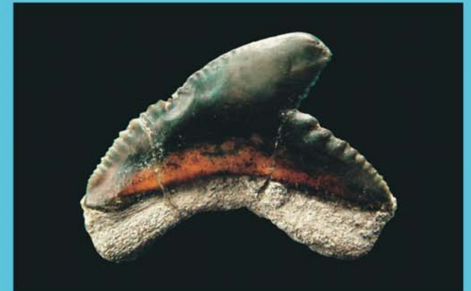
Galeocerdo adunctus , Tigerhai, Smlg. H. Hiden