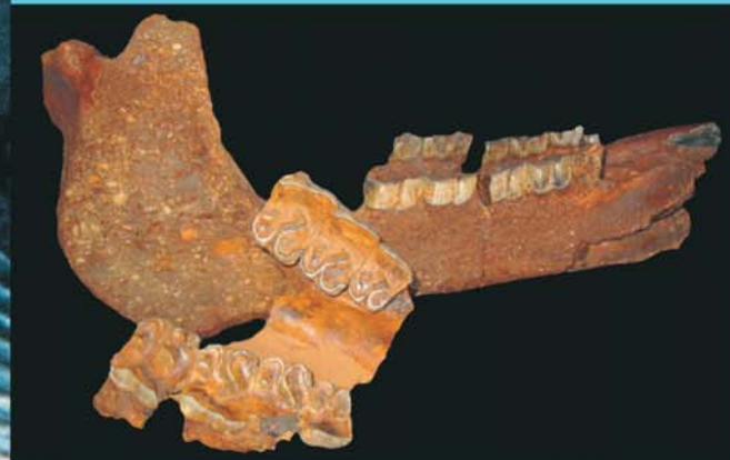
Aceratherium incisivum , Nashorn, Smlg. P. Schebeczek