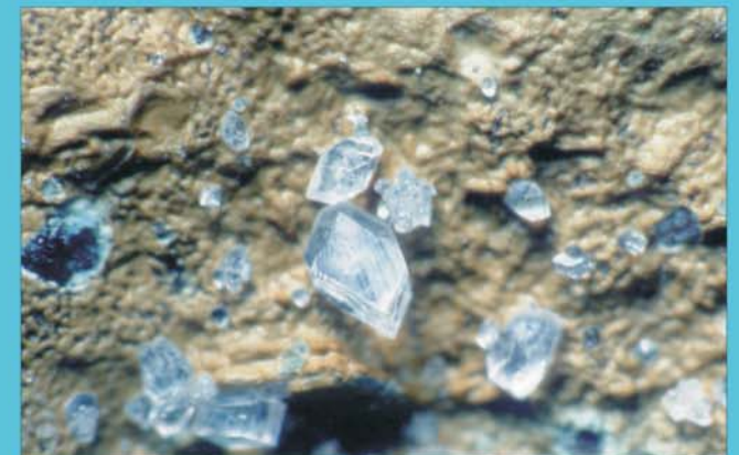
Weinebeneit , Schenkung K. Schellauf, Smlg. Joanneum