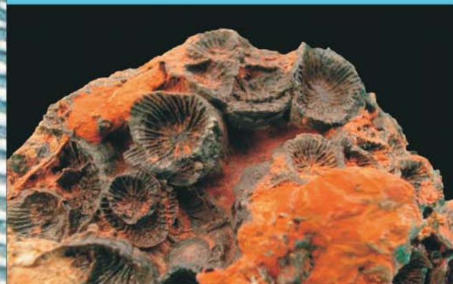
Disphyllum sp., Runzelkoralle, Smlg. F. Messner