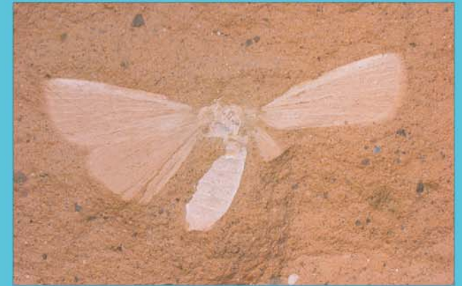
Eulen-Falter , Schenkung V. Hild, Smlg. Joanneum