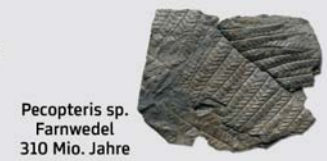
Pecopteris sp. Farnwedel 310 Mio. Jahre

Die Gesteine des Erdaltertums in der Umgebung von Graz und Murau berichten von tropischen Meeren und Kohlewäldern.