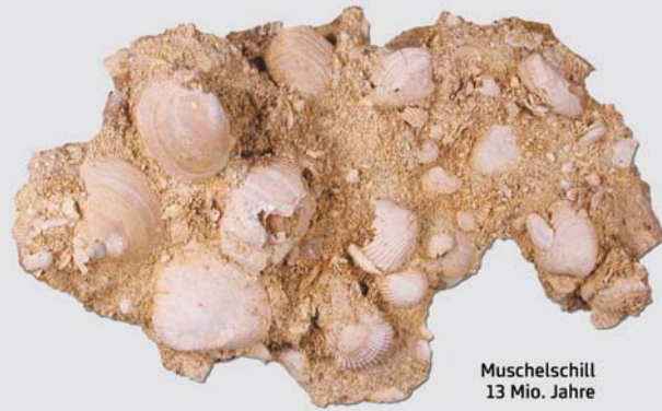
Muschelschill 13 Mio. Jahre

versteinerte Reste vorzeitlicher Lebewesen. Eingebettet in Ablagerungen können uns Schalen, Zähne, Knochen, Abdrücke oder Spuren von tierischen sowie pflanzlichen Organismen erhalten bleiben.