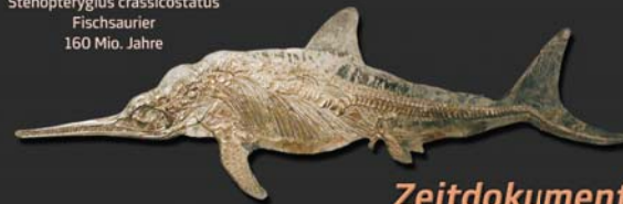
Stenopterygius crassicostatus Fischsaurier 160 Mio. Jahre