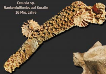
Creusia sp. Rankenfußkrebs auf Koralle 16 Mio. Jahre