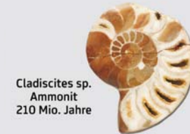
Cladiscites sp. Ammonit 210 Mio. Jahre

Die Felsen der Nördlichen Kalkalpen beinhalten eine große Artenvielfalt an Meeresbewohnern des Erdmittelalters.