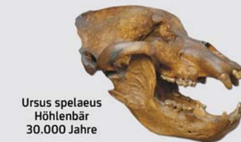
Ursus spelaeus Höhlenbär 30.000 Jahre

In den Kiesterrassen und Höhlen sind Lebensformen der Eiszeit dokumentiert.