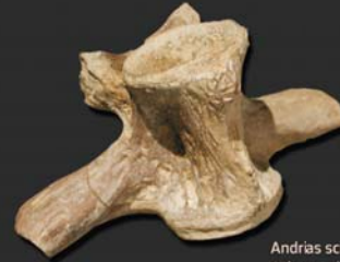
Andrias scheuchzeri Riesensalamander 115 Mio. Jahre