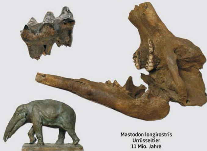
Mastodon longirostris Urrüsseltier 11 Mio. Jahre

die Wissenschaft vom Leben der Vorzeit. Sie untersucht Fossilien, vergleicht mit heute lebenden Organismen und erstellt Rekonstruktionen ehemaliger Lebensräume.