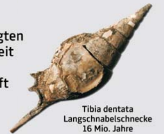
Tibia dentata Langschnabelschnecke 16 Mio. Jahre

Die vorwiegend unverfestigten Ablagerungen der Erdneuzeit zeugen von einer raschen Veränderung der Landschaft im Steirischen Becken.