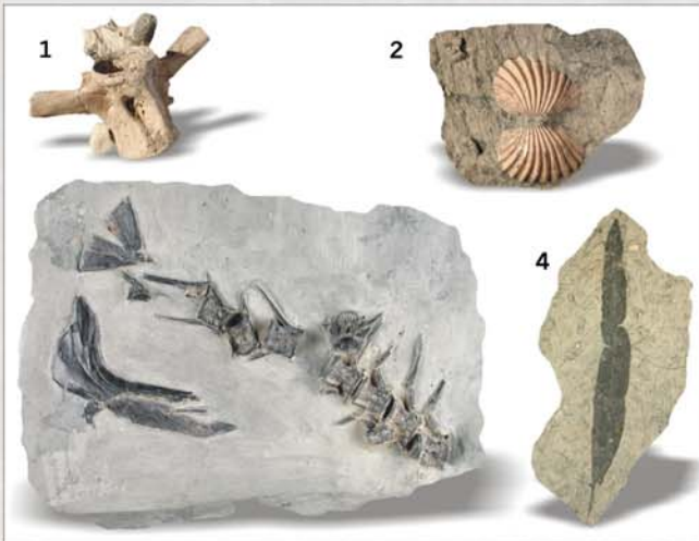
Fossilien aus Mataschen