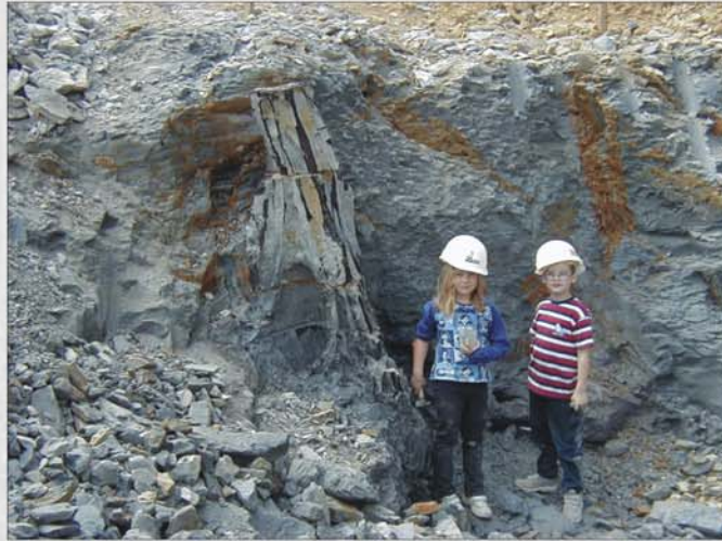
Fossiler Baumstamm in Lebensstellung

In den Tongruben von Mataschen läßt sich eindrucksvoll das Entstehen und anschließende Ertrinken eines Sumpfwaldes am Rande des Pannonischen Sees studieren.