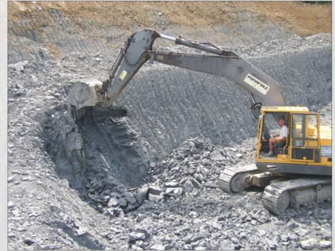
Tonabbau in der "neuen" Tongrube Mataschen

Nach Überflutung des Sumpfwaldes heften sich Wandermuscheln an den Baumstrünken fest. Meterlange Wolfsbarsche, Karpfenfische und Brassen sowie der heute nur noch in Südostasien beheimatete Riesensalamander tummeln sich zwischen den Stämmen. Absinkender Schlamm und Pflanzenreste begraben zunehmend den ehemaligen Wald und konservieren ihn so für viele Millionen Jahre.