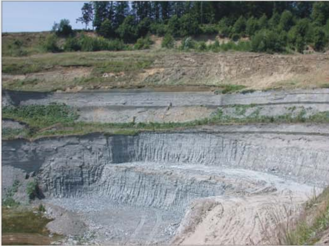
Die "alte" Tongrube Mataschen

Vor 11,5 Millionen Jahren dringt der Pannonische See ins Steirische Becken vor. Zu Beginn entstehen in randlichen Gebieten ausgedehnte Sumpfwälder, die allerdings bei weiter steigendem Wasserspiegel bald überflutet werden.