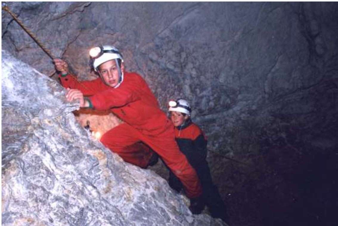
Abb. 3: Beim Höhlentrekking

Ein historisch entwickeltes Beispiel für Naturtourismus sind die Dachsteinhöhlen: die Dachstein-Rieseneishöhle und die Mammuthöhle auf der Schönbergalm und die Koppenbrüllerhöhle im Tal. Seit 1951 wurden 9 Millionen Menschen durch die Dachsteinhöhlen geführt. Über 20 Vollarbeitsplätze werden vom Höhlentouristen (einschließlich Seilbahn und Restaurant) erhalten, wobei es sich durchwegs um solide Arbeitsverhältnisse handelt. Aus ökologischer Sicht muss diese Art des Tourismus befürwortet werden, zumal der menschliche Einfluss konzentriert und kanalisiert wird und eine höchstmögliche Entsorgung von Abwässern und Abfällen gewährleistet ist. Jede geringschätzigere Einstufung von touristischen Konzentrationen muss daher in Hinblick auf den geringen Landschaftsverbrauch je Besucher neu beurteilt werden. Eine deutliche Unterscheidung ist zum billigen Massentourismus zu ziehen. Naturtourismus ist fachlich tiefgehende Information, die mit modernen didaktischen Methoden von bestens ausgebildetem Personal auf einem begrenzten Naturraum vermittelt wird.