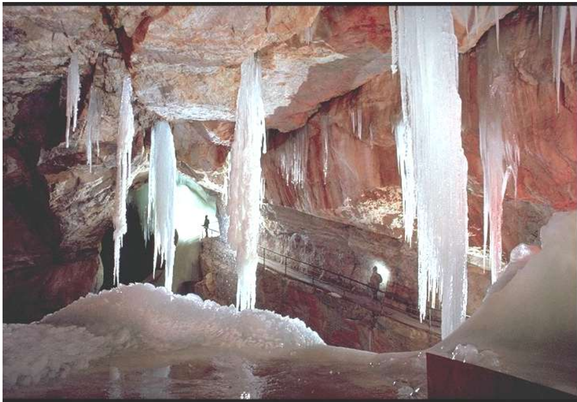
Abb. 2: In der Dachstein-Rieseneishöhle

Im Naturtourismus sieht der Autor einen auf Naturdestinationen ausgerichteten Tourismus, so wie der Kulturtourismus historische Stätten zum Ziele hat, oder der Welterbetourismus Stätten, die von der UNESCO in die World Heritage List aufgenommen wurden. Die begleitenden Maßnahmen für die Förderung dieser Tourismusphilosophie sind Besucherlenkung, um ökologisch sensible Naturräume aus der touristischen Nutzung auszuklammern und störungsfrei zu halten. Andererseits sind touristisch erschlossene Bereiche mit dem Ziel ökonomischer Nachhaltigkeit zu bewirtschaften. Exemplarisch sei die touristische Nutzung im engeren Bereich der Dachsteinbahn, der Dachsteinhöhlen, des Dachsteingipfels, der Schutzhütten, des Echerntales, des Vorderen und Hinteren Gosausees genannt, die einem modernen Tourismusziel entsprechend aufzubereiten sind. Als positives Beispiel können wiederum Nationalparks gelten, allerdings mit einem viel offeneren Bekenntnis zur nachhaltigen ökonomischen Entwicklung. Die Notwendigkeit der Erhaltung und Stärkung der wirtschaftlichen Basis im ländlichen Raum bedarf an dieser Stelle keiner weiteren Erläuterung. Welche fatalen Folgen eine wirtschaftliche Fehlentwicklung haben kann, ist am Beispiel des Raumes Krippenstein-Gjaidalm-Obertraun zu sehen, wo ohne massive Intervention eine Hotelruine inmitten eines Naturschutzgebietes zu entstehen droht.