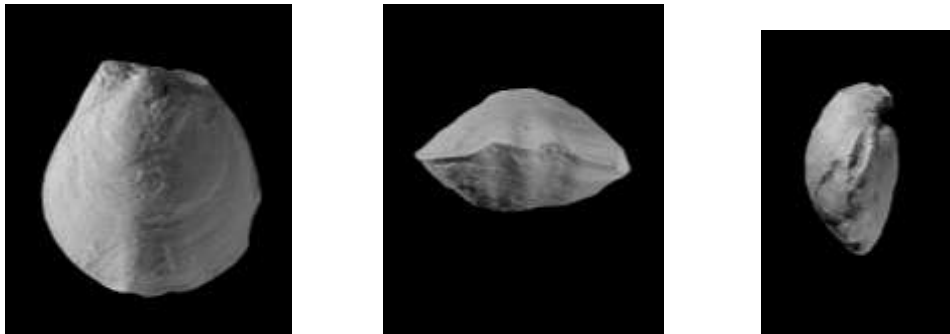
Fig. 2: Adygella bittneri (Wöhrmann). Sulzgraben, Mitterweißenbachtal. Links und Mitte: Dorsal- und Stirnansicht (GBA 2005/2/1) eines Exemplars, rechts: Seitenansicht eines anderen Exemplars (Sammlungen der GBA, Aquis.-Nr. 2005/2/2) (Vergrößerung: 2x).

Material: 6 Exemplare mit teilweise zerbrochenen Klappen. Die besser erhaltenen Stücke haben folgende Dimensionen: ?17,0 x 14,9 x 8,6 mm (Abb. 2 links und Mitte); ?14,5 x 11,2 x 6,4 mm; 14,3 x 11,8 x 6,2 mm (geschliffen); 13,3 x 12,5 x 7,0 mm (Abb. 2 rechts). Das Material ist in den Sammlungen der Geologischen Bundesanstalt in Wien (GBA) deponiert.