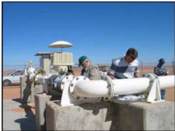
Abb. 3: Brunnen in der Libyschen Wüste (Hasawina Field)

Die Wassergewinnung und Nutzung hängt einerseits von den klimatischen sowie geologischen und hydrogeologischen Randbedingungen ab, wird andererseits aber auch noch durch Tradition und durch den ehemaligen Kolonialismus geprägt. So zeigt sich der Einfluss der Franzosen in manchen frankophonen Ländern Westafrikas durch die Bevorzugung einer risikoärmeren Wassererschließung in Form von Oberflächenwasser mit entsprechenden Aufbereitungsanlagen. Die Erschließung von nativem Trinkwasser durch Bohrungen und Brunnen ist hingegen mit einem wesentlich höheren geologischen und auch technischen Risiko behaftet. So liegt die Fündigkeitsrate bei der Wassererschließung aus Kluftaquifere in Ländern der Sahelzone und der im Süden anschließenden Gras- und Buschsavannen aber auch in weiten Teilen des südlichen Afrikas, wie Südafrika, Namibia, Botswana und Zimbabwe, nach wie vor bei 25 bis 30 %.