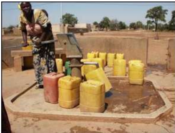
Abb. 2: Dorfbrunnen in Koubri (Burkina Faso)

Die Probleme Afrikas sind mehrschichtig. Als eines der gravierenden Probleme ist das mangelnde Nahrungsangebot und damit eng verknüpft die Wasserproblematik zu sehen. Die Trinkwasserproblematik als Ganzes umfasst nicht nur die „Ressource Wasser“ sondern auch deren Erschließung, Verteilung und Schutz (Grundwasserschutz). Die sich aus einem optimierten WasserRessourcenManagement ergebende Nachhaltigkeit ist in Afrika weder in den „reicheren“ noch in den „ärmeren“ und „armen“ Ländern ein Begriff. So kommt es bei den großen Trinkwasserprojekten in Libyen durch massive Übernutzung der Aquifere (= Grundwasserleiter) – diese enthalten Tiefengrundwässer als Relikt vergangener Eiszeiten – zu Absenkungen der Wasserspiegellagen zwischen 0,8 bis 1,5 m/Jahr. In anderen Ländern kommt es vor allem im Umfeld von Städten und Industrien durch fehlenden Umweltschutz zu massiven, teilweise irreparablen Verunreinigungen der oberflächennahen Grundwasserleiter.