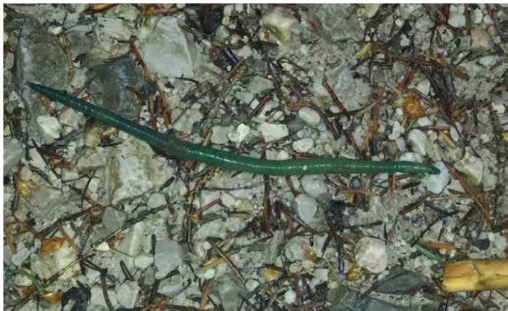
Abb. 2: Aporrectodea smaragdina am Fundort nahe des Toblacher Sees

Der rezente Fund eines adulten Tieres wurde am 2.6.2017 am Wegesrand eines Wanderweges südlich des Toblacher Sees bei Toblach gemacht (WGS83: 46.69853° N 12.21581° E, Abb. 2). Die Bedingungen zum Zeitpunkt des Fundes am frühen Morgen waren eine fast gesättigte relative Luftfeuchtigkeit (ca. 95 %) mit Morgentau und recht tiefe Lufttemperaturen um 10 °C (OPENDATASÜDTIROL 2018).