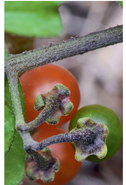
Abb. 16: Solanum alatum, Bozen