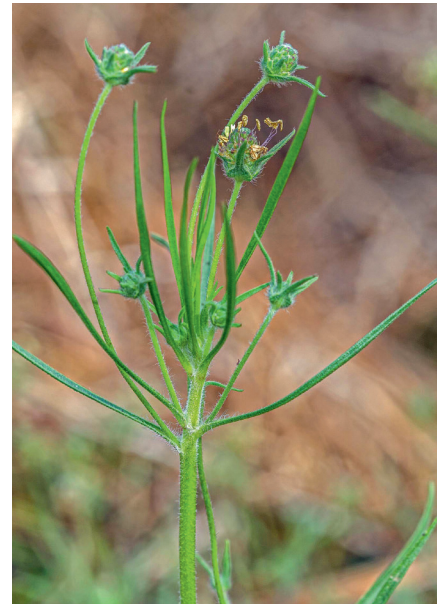
Abb. 15: Plantago arenaria, Olang