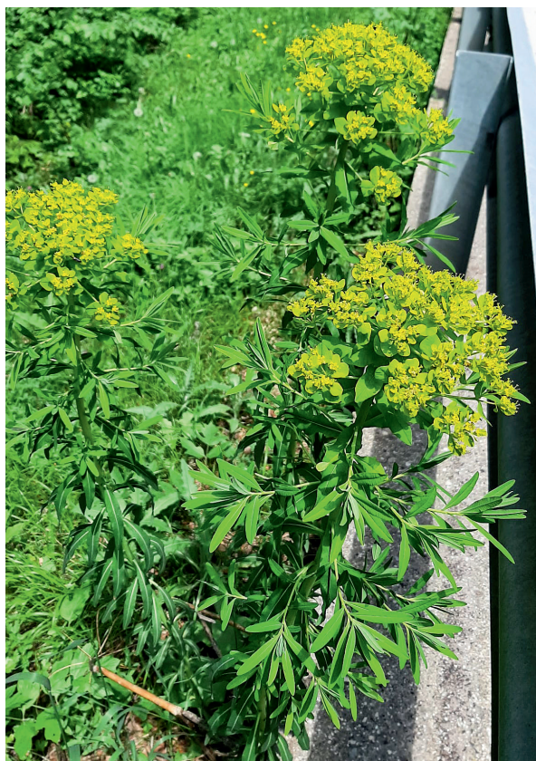
Abb. 7: Euphorbia palustris, Tiers.

Status: nicht heimisch, wohl unbeständig