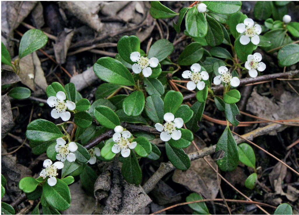
Abb. 3: Cotoneaster dammeri, Eppan