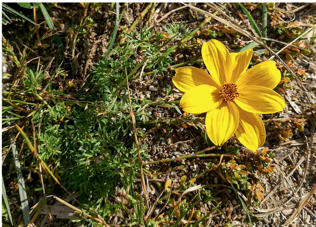
Abb. 2: Bidens triplinervia, Gsies