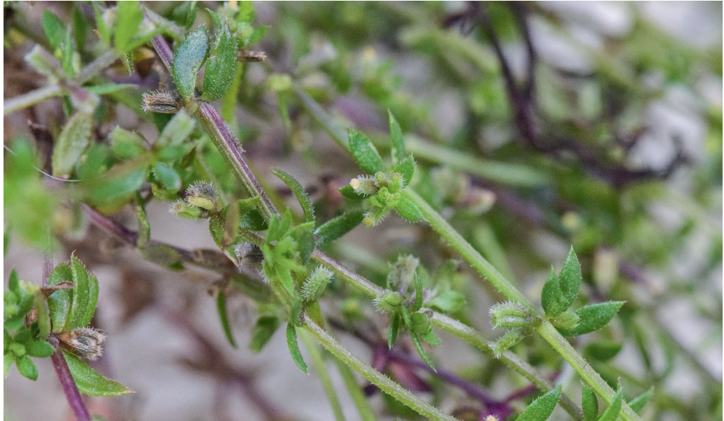
Abb. 8: Galium murale , Bozen (Foto T. Wilhalm, 6.5.2021)

zunehmend sekundär weiter nach Norden aus (PIGNATTI et al. 2017–19). Die nördlichsten allochthonen Vorkommen im Bereich der Alpen gab es bislang in der Schweiz (INFO FLORA 2004-; bei HESS et al. 1972 noch fehlend), in der Provinz Belluno (PELLEGRINI et al. 2019) und im Trentino, wo die Art erstmals vor 15 Jahren entdeckt wurde (PROSSER 2008). Sie ist dort heute im Gardaseegebiet und nördlich davon fest eingebürgert und wächst nahezu ausschließlich auf gepflasterten Gehsteigen und Parkplätzen vornehmlich schattiger und tiefer Lagen (PROSSER et al. 2019). Diese Situation lässt sich auch in der Stadt Bozen beobachten, wo die Art in kürzester Zeit ein ganzes Stadtviertel besiedelt hat und zwar nahezu ausschließlich in Pflasterritzen. Galium murale scheint in Bozen sehr lokal und zufällig eingeschleppt worden zu sein mit nachfolgender rascher und effizienter Ausbreitung. Der Abstand zum nächsten bekannten Vorkommen im Trentino beträgt immerhin rund 50 km.