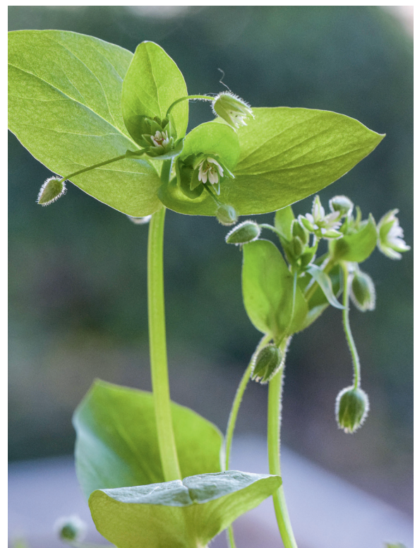
Abb. 13: Stellaria ruderalis, Bozen