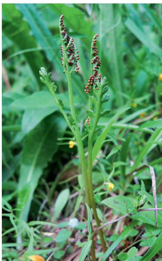
Abb. 14: Botrychium matricariifolium, Ritzail