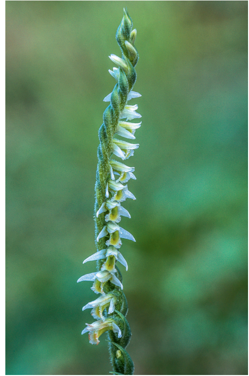
Abb. 12: Spiranthes spiralis, Salurn