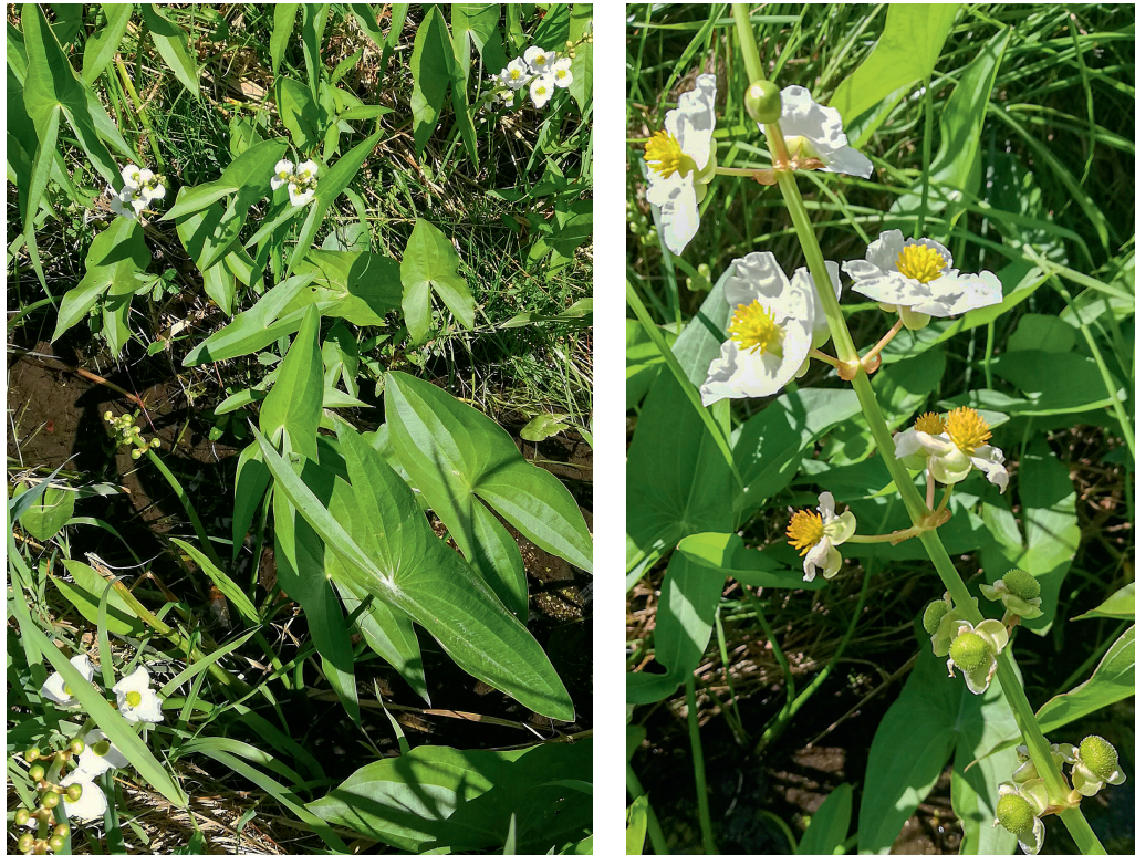
Abb. 11: Sagittaria latifolia, Kurtatsch