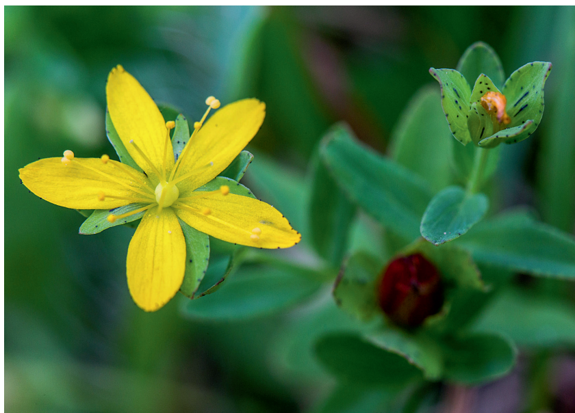
Abb. 9: Hypericum humifusum, Fassang