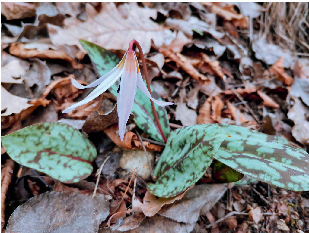
Abb. 6: Erythronium dens-canis , Kaltern (3.3.2021)