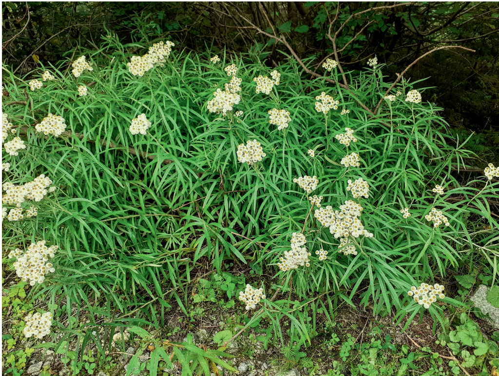
Abb. 1: Anaphalis margaritacea, Vals (, 28.8.2021)

licherweise wurden sie über Aushubmaterial eingebracht, zumal weitum keine Anpflanzungen bekannt sind.