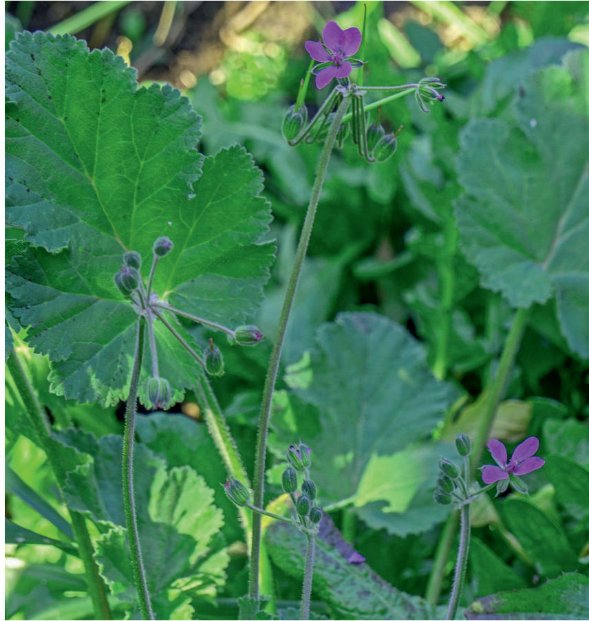
Abb. 5: Erodium malacoides , Issing (Foto M. Da Pozzo, 9.9.2021)