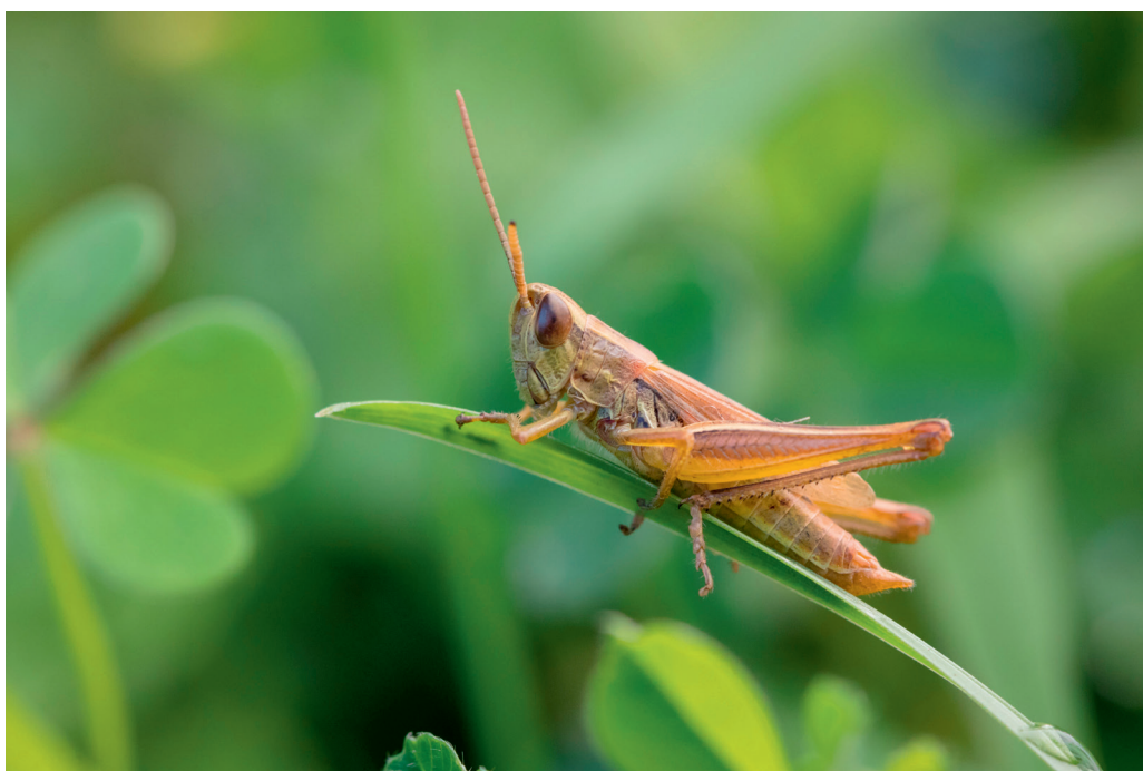
Abb. 3: Euchorthippus declivus , Altrei, Details siehe Text (Foto V. Heimer, 3.8.2021).