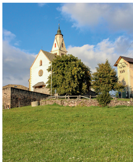
Abb. 2: Einer der Standorte von Bicolorana bicolor und Euchorthippus declivus unterhalb der Kirche von Altrei, Details siehe Text.