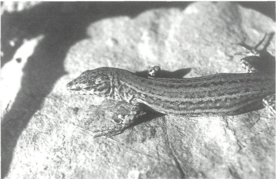
Abb. 2: Subadultes Männchen von Podarcis p. pityusensis (BOSCA, 1883), fotografiert am 15. Mai 1992 am Yachthafen von Cala Ratjada, Mallorca.