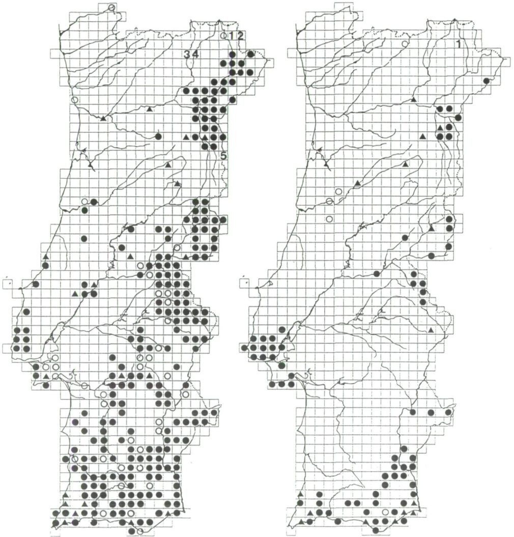
Abb. 1 (links): Verbreitung von Mauremys leprosa (SCHWEIGGER, 1812) in Portugal. ● - Fundorte des Autors (1976-1993), Δ - Fundorte aus der Literatur und von Gewährsleuten (nach 1975), ○ - Fundorte aus der Literatur (1863-1975), 1 bis 5 - neue Fundmeldungen (siehe Text).