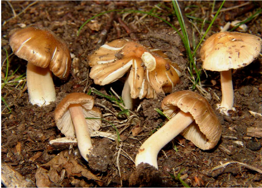
Inocybe glabrodisca am Fundort

Wegen der Seltenheit dieses Fundes sollen hier meine Abbildungen gezeigt und meine Fundnotizen genannt werden: