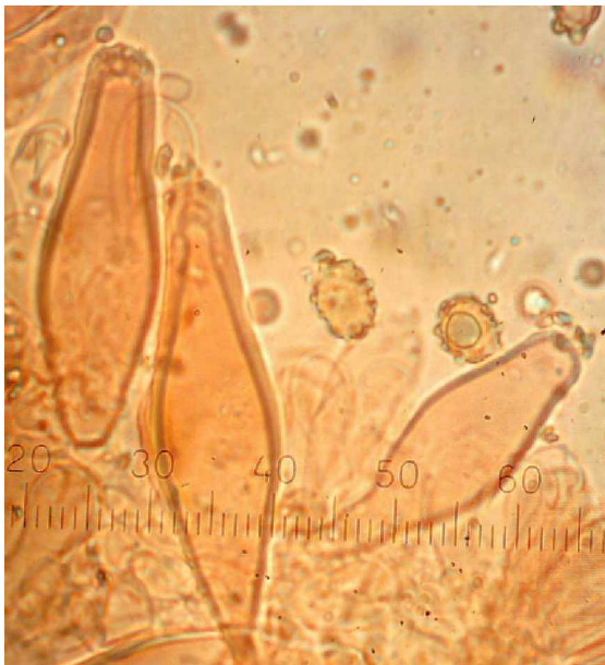
Cheilocystiden und Sporen (abgebild. Maßstab x 1,5 µm)