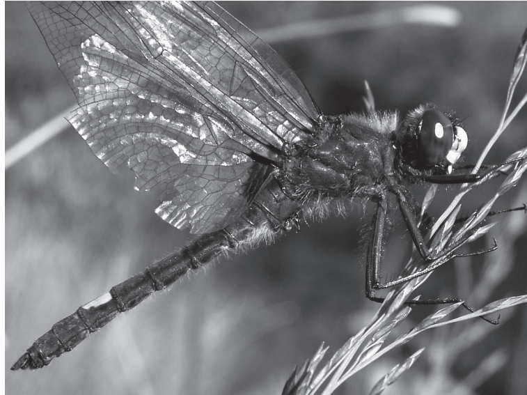
Abb. 2. Dieses ältere Männchen der Großen Moosjungfer Leucorrhinia pectoralis konnte am Rand des Grabens der Abb. 3 am 3.07.06 aufgenommen werden. Es handelt sich um die einzige Libellenart der FFH-Richtlinie, die im Mandlinger Moor beobachtet wurde. Im Bundesland Salzburg ist diese Art sonst nur an drei Stellen des nördlichen Alpenvorlandes nachgewiesen. Es handelt sich somit um den ersten Nachweis im Pongau.

Möglicherweise handelt es sich um das Reliktvorkommen einer im Salzburger Ennstal zwischen etwa Radstadt und