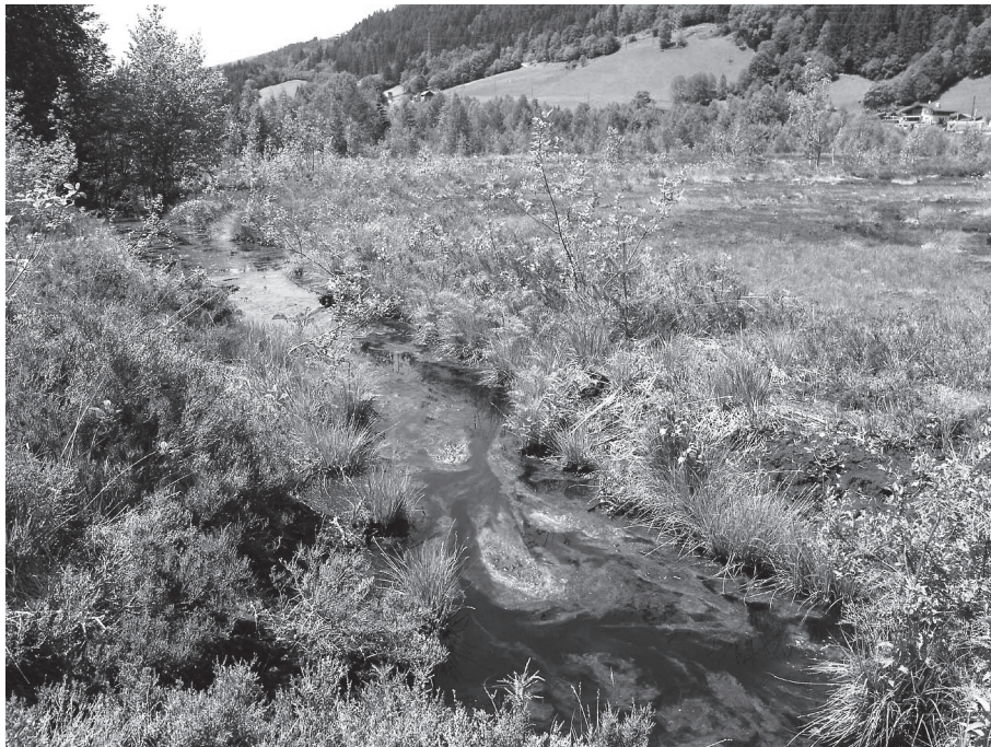
Abb. 3. Ehemalig industriell abgetorfte Hochmoorbereiche des Mandlinger Moores. Der abgebildete, nur teilweise beschattete Entwässerungsgraben wurde der Sukzession überlassen. Das Wasser steht mehr oder weniger still. Hier wurde die EU-geschützte Große Moosjungfer Leucorrhinia pectoralis beobachtet.