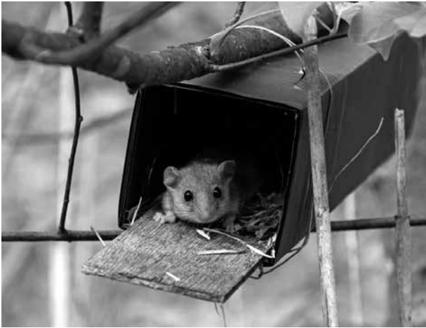
Abb. 2. Neströhre (Foto: Blatt/Resch).