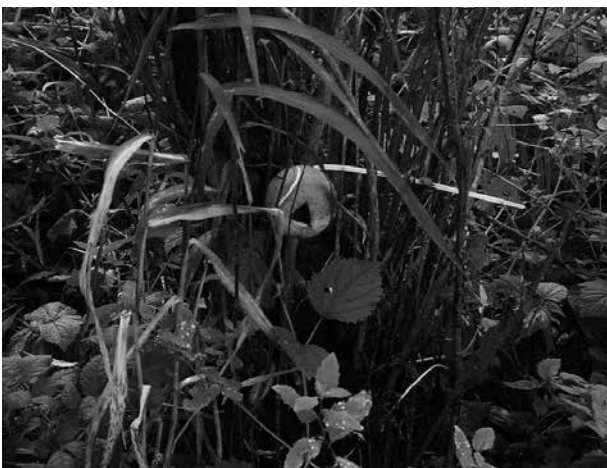
Abb. 4. Nestball.

Der Nachweis von Wasserspitzmäusen erfolgte mit Losungstunneln (Abb. 5). Diese Polypropylen-Rohrstücke ( d = 4,5 \text{ cm} , l = 20 \text{ cm} ) wurden mit gekochten Mehlwürmern beködert und in regelmäßigen Abständen entlang geeigneter