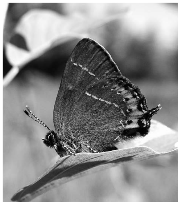
Abb. 1. Der Pflaumen-Zipfelfalter ( Satyrium pruni) wird erstmals für das Gemeindegebiet von Koppl gemeldet. Im untersuchten Garten hielt sich ein Individuum im Bereich einer gut strukturierten Schlehenhecke am 7.06.2014.