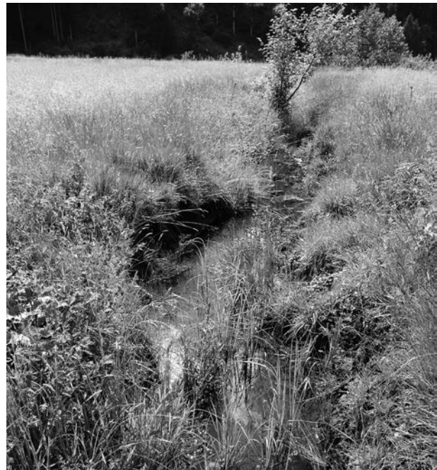
Abb. 3. Flugplatz der Gabel-Azurjungfer im Adneter Moor.