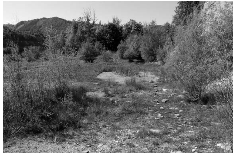
Abb. 2. Flugplatz der Gabel-Azurjungfer am Gutrathberg bei Hallein.

C. scitulum besiedelt stehende oder fließende, meso- bis eutrophe Gewässer, wobei angenommen wird, dass die Larven besonders wärmebedürftig sind (vgl. STERNBERG & BUCHWALD 1999). Das erklärt auch die Funde der thermophilen Begleitarten S. fonscolombii und O. brunneum in Salzburg, die hier v. a. vegetationsarme, sich rasch erwärmende Gewässer bevorzugen. Nach GRAND & BOUDOT (2006) benötigt C. scitulum Gewässer mit oberflächennaher, aquatischer Vegetation. KOTARAC (1997) spricht zudem von einer Präferenz für kalkhaltiges Wasser. All diese Faktoren sollten bei der Suche weiterer Fundorte dieser Libellenart in Salzburg in Zukunft berücksichtigt werden.