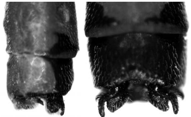
Abb. 4. Typische Hinterleibsanhänge des Männchens der Gabel-Azurjungfer, das am Gutrathberg am 4. Juni 2015 gefangen wurde. Links: Seitenansicht; rechts: Dorsalansicht.