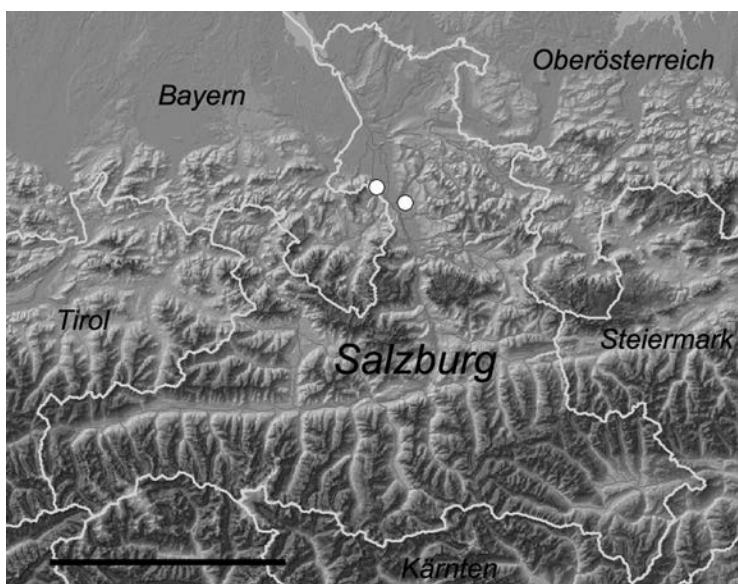
Abb. 1. Fundorte der Gabel-Azurjungfer Coenagrion scitulum (Rambur, 1842) im Bundesland Salzburg (weiße Kreise). Darstellung auf Basis der Quadranten 3' x 5' der österreichischen Messtischblätter (Maßstab: 50 km).

Besonders hervorzuheben ist die Tatsache, dass hier ca. 50 Individuen der oberflächlich betrachtet recht ähnlichen und häufigen Hufeisen-Azurjungfer ( Coenagrion puella ) beobachtet wurden. Bemerkenswerte Begleitarten waren die Frühe Heidelibelle ( Sympetrum fonscolombii ) und der Südliche Blaupfeil ( Orthetrum brunneum ).