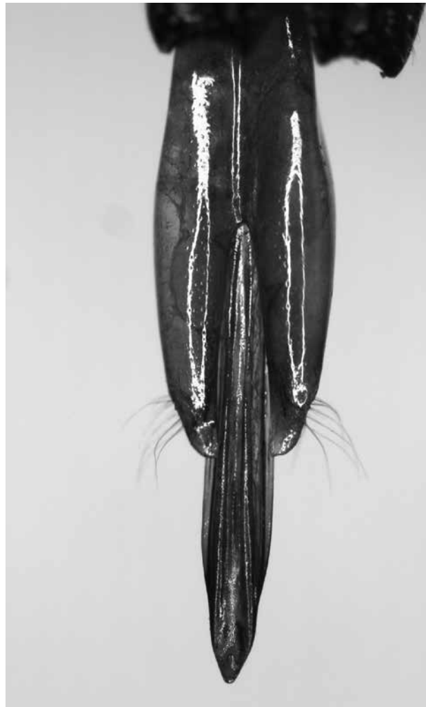
Abb. 3. Detailaufnahme: Aedeagus (männlicher Geschlechtsapparat) des Belegs von Dicerca berolinensis aus Grödig.