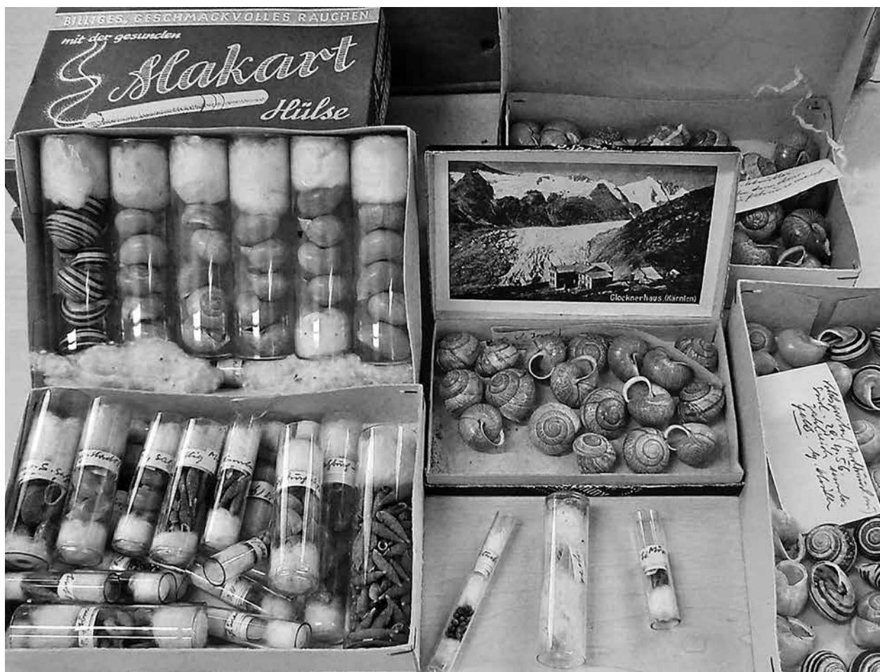
Abb. 1. Teile der Sammlung Schüller, wie sie 2011 vorgefunden wurde.

Fundort und Datum versehen aber nicht bestimmt (PATZNER 2015a). Das Sammlungskonvolut wurde am Haus der Natur mit der Eingangsnummer 2011/64 versehen (R. Lindner pers. Mitt.).