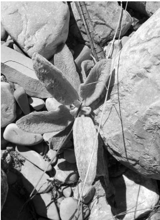
Abb. 7. Adventives Einzel Exemplar des Woll-Ziestes ( Stachys byzantina ) im Tauglgries der Gemeinde Bad Vigaun.