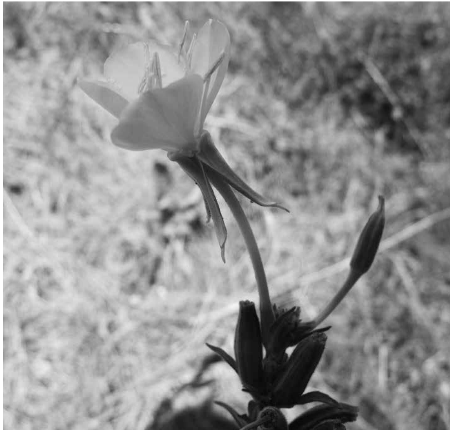
Abb. 5. Eine Blüte, Blütenknospe und Früchte der Trug-Nachtkerze ( Oenothera x fallax ) an der Autobahnböschung in Kuchl (Foto: G. Pflugbeil, 2015).

Die in China beheimatete Paulownie ist ein schnellwüchsiger, ornamentaler Laubbaum, der seit seiner Einführung nach Mitteleuropa im 19. Jahrhundert vor allem im städtischen Raum in Gärten und Grünlagen kultiviert wurde (MOSANDL & STIMM 2014). Die auffälligen blaviolettten, eng glockenförmigen Blüten sind bis zu 5 cm lang und in aufrechten Rispen angeordnet.