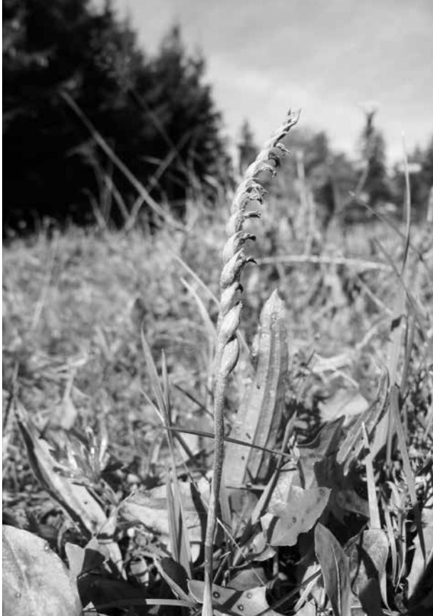
Abb. 6. Abgeblühte Infloreszenz der Herbst-Wendelähre ( Spiranthes spiralis ) am Rengerberg/Bad Vigaun.