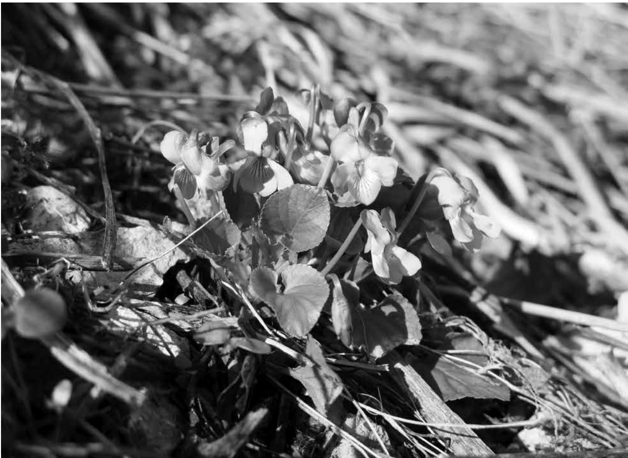
Abb. 9. Habitus des Pyrenäen-Veilchens ( Viola pyrenaica) im Bluntauental/Golling.