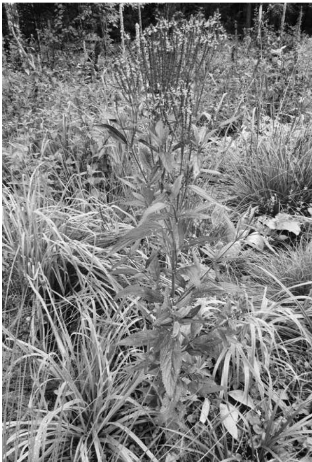
Abb. 8. Habitus des Lanzen-Eisenkrautes ( Verbena hastata ) in einer Ruderalflur bei Kuchl.

Flachgau, Wolfgangseegebiet, Mündungsbereich des Zinkenbaches in den Wolfgangsee, E vom Gelände des Campingplatzes zwischen Zinkenbach und Straße zum See, unter einem Holunderstrauch neben einer Holzhütte, 540 msm, MTB: 8246/4, Koordinaten: 13,43333 Ost, 47,73528 Nord, 13.04.2009, leg. P. Pils (Herbarium Pils). – Lungau,