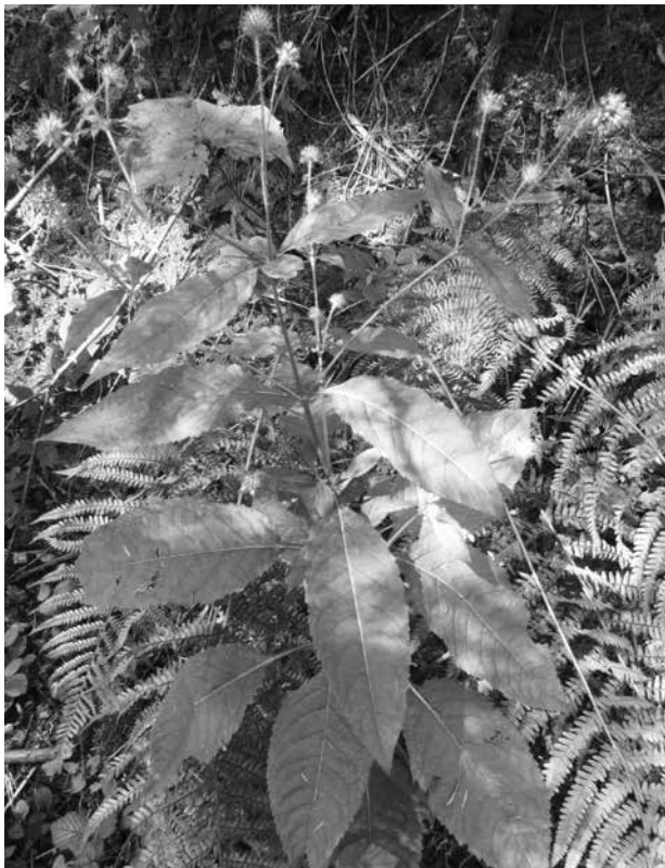
Abb. 2. Habitus der Borsten-Karde ( Dipsacus pilosus ) an einem Forststraßenrand in Kuchl.

Vermutlich NEU für Salzburg: Dieses Süßgras gehört wie alle Fingerhirsen ( Digitaria sp.) zur Gruppe der Fingerährengräser mit undeutlich handförmig angeordneten Ähren an der Spitze