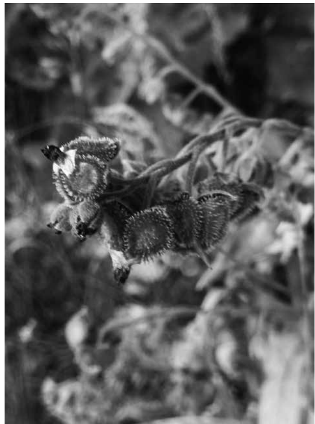
Abb. 1. Die typischen Klausenfrüchte der Echt-Hundsunge ( Cynoglossum officinale ) in Kuchl (Foto: C. Langer, 2015).

Die Echt-Hundsunge (Abb. 1) aus der Familie der Raublattgewächse (Boraginaceae) ist eine Volksarzneipflanze. Sie kommt in allen Bundesländern Österreichs zerstreut vor (FISCHER et al. 2008), so auch in Salzburg, wo die Art von der collinen bis zur montanen Vegetationsstufe bekannt ist. Die Nachweise der Echt-Hundsunge liegen jedoch häufig weit voneinander entfernt. Der einzige bisher bekannte Fundpunkt im Tennengau stammt aus Abtenau (LEEDER & REITER 1959). In dieser Veröffentlichung können nun drei weitere – verhältnismäßig weit voneinander entfernte – Vorkommen genannt werden. Der Standort im Göll-Massiv am Fuß einer überhängenden Kalkfelswand, der als Unterstand von Gämsen genutzt wird, bietet für die Echt-Hundsunge offensichtlich geeignete Wuchsbedingungen. Ein Vorkommen auf einer Wildlägerflur mit ähnlichen Standortverhältnissen konnte im Naturwaldreservat Mitterkaser im Steinernen Meer getätigt werden (weitere interessante Funde dieses Naturwaldreservates, wie Eriophorum scheuchzeri oder Pyrola media werden in EICHBERGER et al. 2015 angeführt). Da wie dort wachsen in unmittelbarer Nähe der Hundsunge auch Groß-Brennnessel ( Urtica dioica ) und Guter Heinrich ( Chenopodium bonus-henricus ). Solche Wildlägerfluren sind jedoch nur einer von mehreren potentiellen Standorten für die Echt-Hundsunge, die auch auf Almweiden, Grashängen, Wald- und Wegrändern sowie ande-