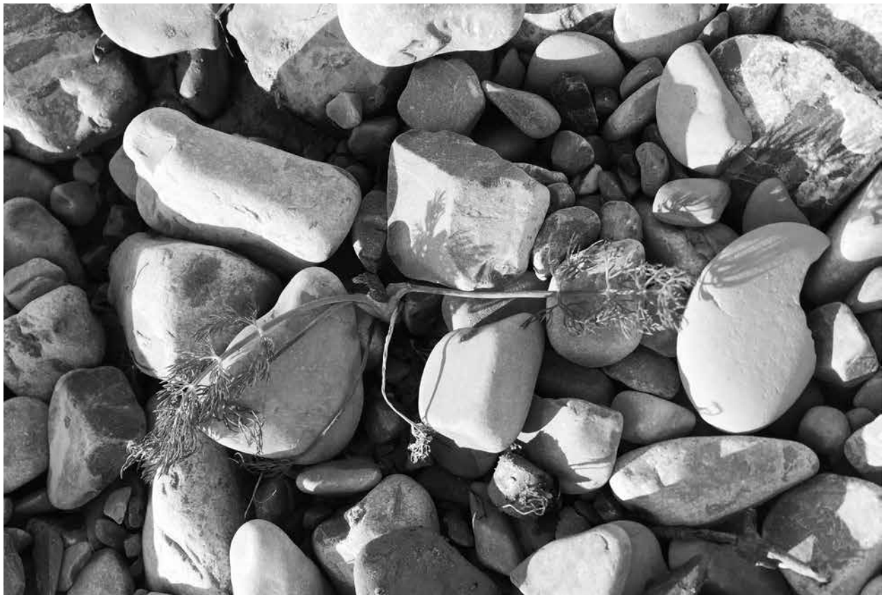
Abb. 3. Adventives Einzelexemplar des Fenchels ( Foeniculum vulgare ) im Tauglgries der Gemeinde Bad Vigaun (Foto: K. Moosbrugger, 2016).

Ost, 47,71482 Nord, 27.06.2016, vid. H. Wittmann – Tennengau, Salzachtal, Kuchl, Areal des Bahnhofes Kuchl, 460 msm, MTB: 8344/4, Koordinaten: 13,14036 Ost, 47,62912 Nord, 12.05.2016, vid. H. Wittmann. – Tennengau, Golling an der Salzach, Bahndamm im südlichen Ortsbereich, 470 msm, MTB: 8445/1, Koordinaten: 13,16886 Ost, 47,59260 Nord, 05.05.2016, vid. H. Wittmann.