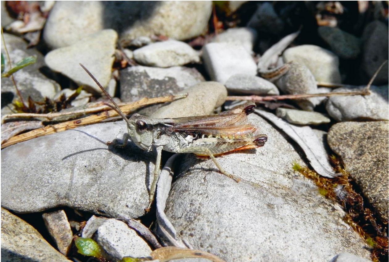
Abb. 1 Kiesbank-Grashüpfer ( Chorthippus pullus , Männchen)