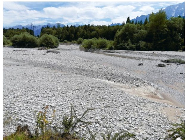
Abb. 3 Natur- und Europaschutzgebiet Tauglgries mit dem Hauptvorkommen des Kiesbank-Grashüpfers ( Chorthippus pullus) im Bundesland Salzburg