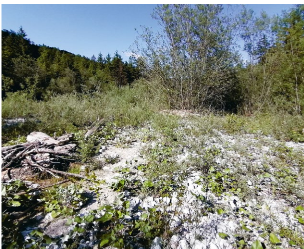
Abb. 7 Nachweis des Kiesbank-Grashüpfers ( Chorthippus pullus) am 13.06.2023 auf dieser Alluvione am Torrener Bach (Bluntautal)

besonnte Rohböden mit spärlicher Vegetation. Ohne entsprechende Pflegemaßnahmen in Form von Gehölz-entfernungen würde der Lebensraum für den Kiesbank-Grashüpfer hier in kurzer Zeit ungeeignet, was zu einem drastischen Habitatverlust führen würde.