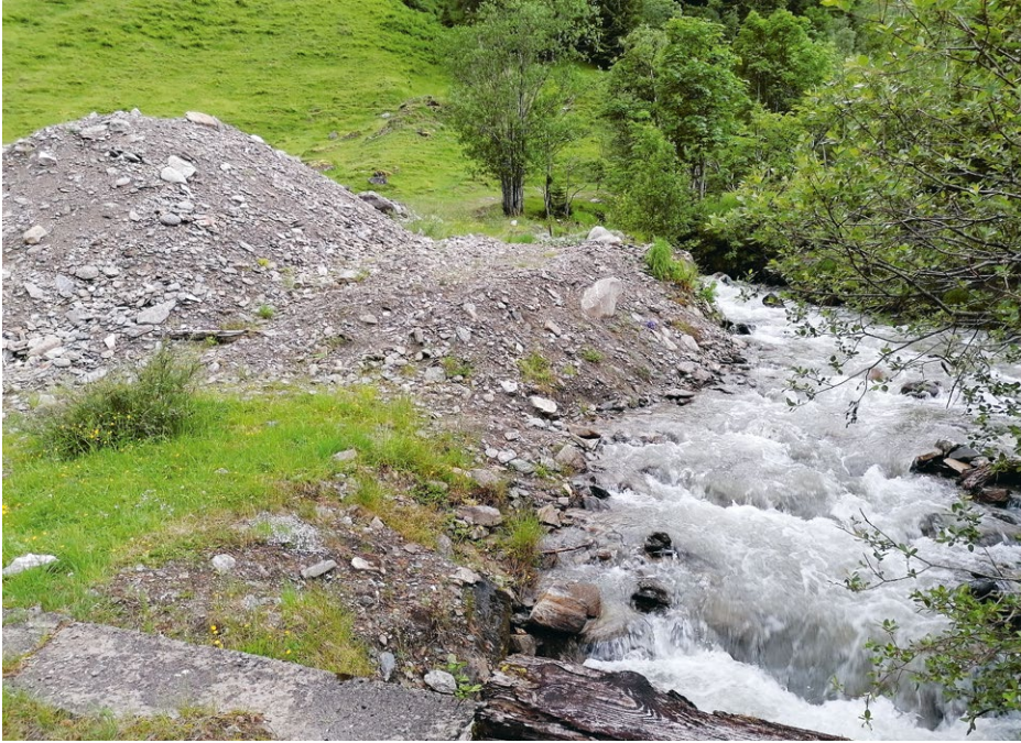
Abb. 10 Anhäufung von Bachschotter am Boggeneigraben (Ferleiental) inmitten des Lebensraumes von Chorthippus pullus