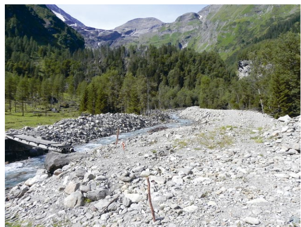
Abb. 4 Käfertalbach (Ferleiental) - Ursprung der Fuscher Ache - als Lebensraum des Kiesbank-Grashüpfers ( Chorthippus pullus) in den Hohen Tauern