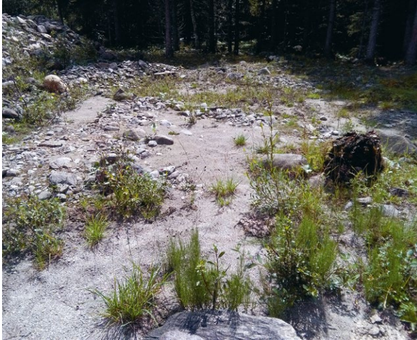
Abb. 5 Alluvione am Käfertalbach - Habitattyp des Kiesbank-Grashüpfers ( Chorthippus pullus)