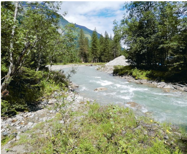
Abb. 6 Sand- und Schotterbänke am orographisch linken Ufer der Fuscher Ache als Habitat des Kiesbank-Grashüpfers ( Chorthippus pullus)