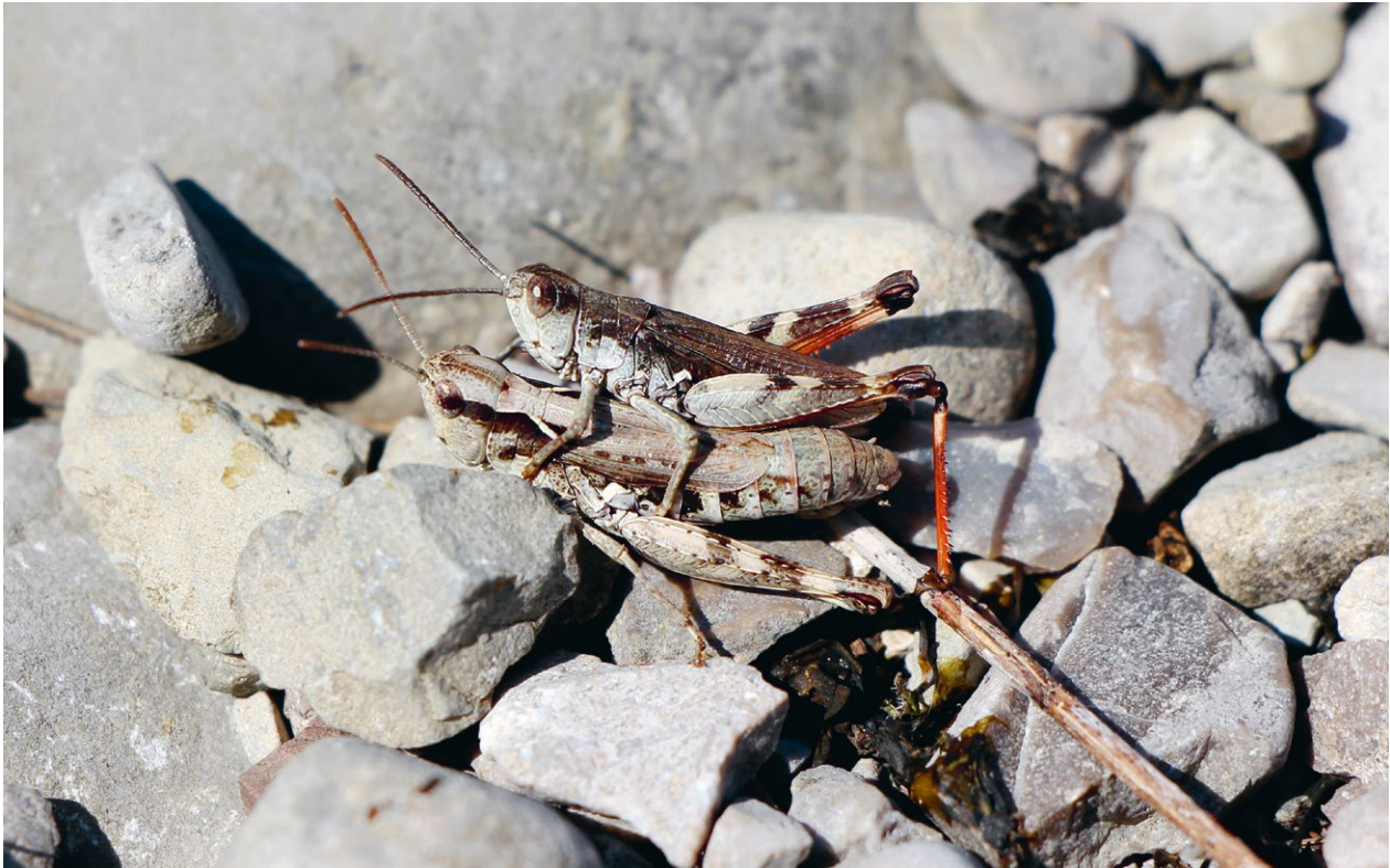
Abb. 8 Kiesbank-Grashüpfer ( Chorthippus pullus ) in Kopula