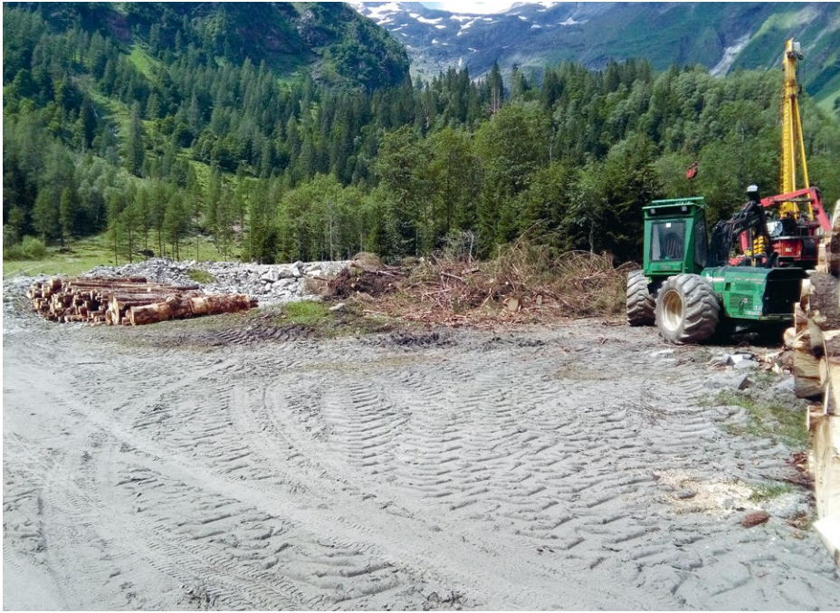
Abb. 9 Holzverarbeitung inmitten des Lebensraumes von Chorthippus pullus im Uferbereich des Käfertalbaches (Ferleital)