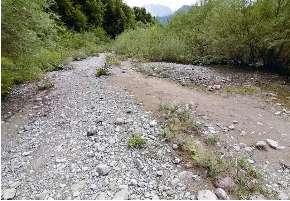
Abb. 5 Im Europaschutzgebiet Tauglgries kommt die Sumpfgrille an einem Quellaustritt im Uferbereich des Tauglbaches vor. Von dort dringt sie auch auf die Alluvionen vor, wo sie mit dem vom Aussterben bedrohten Kiesbank-Grashüpfer vergesellschaftet ist.