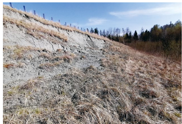
Abb. 4 Seit 2017 kommt die Sumpfgrippe regelmäßig mit wenigen Individuen in einer aufgelassenen Lehmgrube bei Lukasedt vor. Kleine Hangrutschungen sorgen hier für vegetationsfreie Bereiche, die sich bei Sonneneinstrahlung rasch erwärmen.