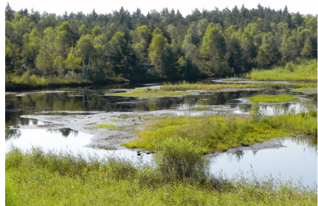
Abb. 3 Ein Verbreitungsschwerpunkt der Sumpfgrippe im Bundesland Salzburg liegt im Europaschutzgebiet Weidmoos. Hier erfolgte am 20. August 2011 der Erstnachweis.