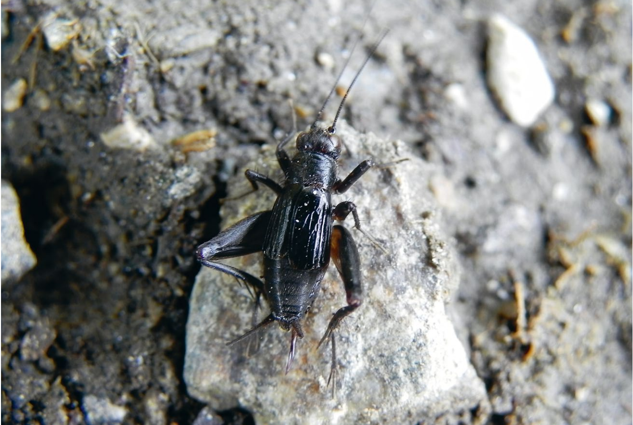
Abb. 1 Sumpfgrille ( Pteronemobius heydenii , Weibchen)