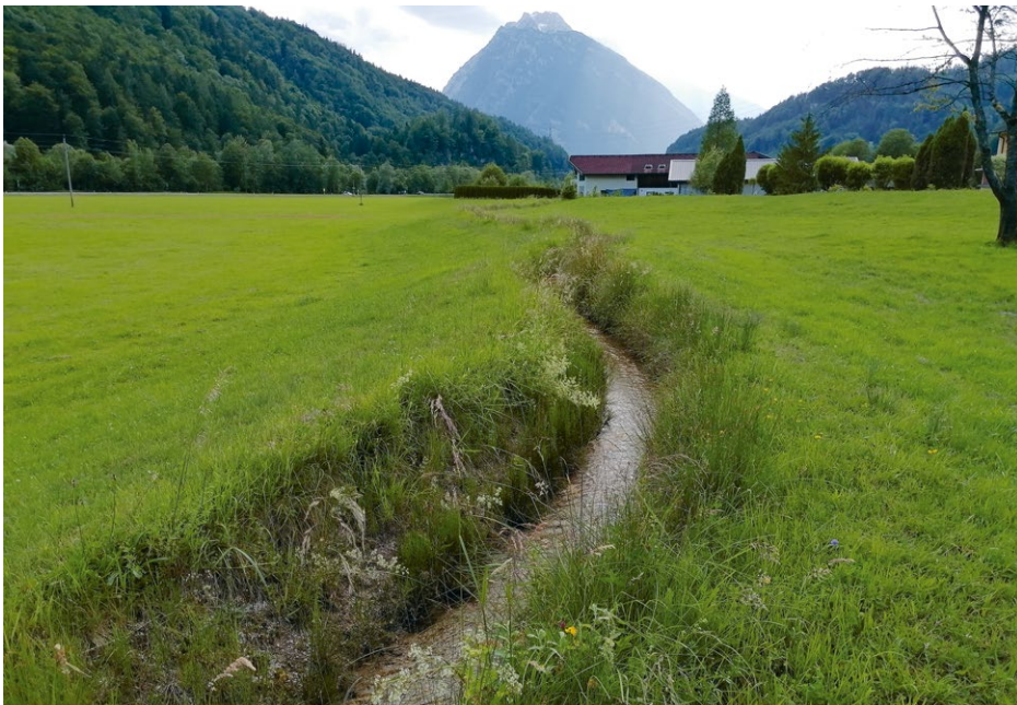
Abb. 6 Inmitten von Wirtschaftswiesen gelegen bietet die spärlich bewachsene Uferböschung dieses Gerinnes in Unterscheffau am Tennengebirge offensichtliche ideale mikroklimatische Voraussetzungen für die Sumpfgrille.

karg bewachsene Bachbett vor (Abb. 5). 2023 gelang die Dokumentation in Form eines Beleges. Als Begleitart ist hier der vom Aussterben bedrohte Kiesbank-Grashüpfer ( Chorthippus pullus ) zu erwähnen (ILLICH 2024). Zeitgleich zu diesem Fund gab es noch einen weiteren Nachweis in Modernmühl bei Kuchl, wo am Gewässerstrand eines Tümpels etliche Individuen zirpten.