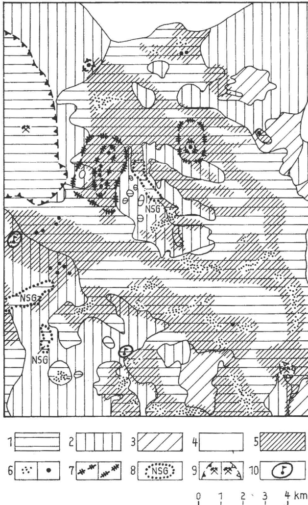
Abb. 2. Karte zur schadlosen Ablagerung von Abprodukten und Darstellung von havariegefährdeten Gebieten – generalisierter Ausschnitt

Als Synthese der beschriebenen Erfassung hydrogeologischer, geographischer und anthropogener Daten wird die „Karte zur schadlosen Ablagerung von Abprodukten und zur Darstellung von havariegefährdeten Gebieten“ zusammengestellt. Die Karte im Maßstab 1:25 000 enthält folgende Detaileintragungen.