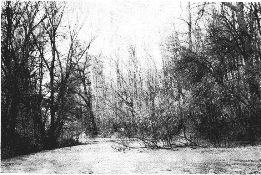
Abb. 1. Die „Kulke“ bei Leipzig Lützschena

lenta L.) vertreten. Die Individuendichte dieser Art ist nicht sehr hoch, doch ist sie in jedem Jahr anzutreffen; die ermittelten Fangzahlen belaufen sich auf 5 bis 20 Tiere pro Jahr und liegen damit deutlich niedriger als bei anderen vergleichbaren Gewässern des Leipziger Auenwaldes. Damit sind diese Tiere trotzdem als gemein (g) verbreitet einzustufen (Große 1977). Interessante Aspekte ergeben sich bei Langzeituntersuchungen an den Wassermolchpopulationen dieses Gewässers. Vom Gewässertyp her (Altwasser) sind bei aller Eigenheit durch Pflanzenwuchs und Wasserqualität Teichmolch ( Triturus vulgaris L.) und Kammolch ( Triturus cristatus Laur.) zu erwarten und auch gemein anzutreffen. Nach langjährigen Beobachtungen (1960–1978) kann man feststellen, daß der Teichmolch die häufigste Art ist und auch in fast jedem Jahr gefunden wurde. Der Kammolch weist eine ganz geringe Flächendichte auf (Feldmann 1971). Auffällig ist die Dichteverteilung über längere Zeiträume (Abb. 2). In einem siebenjährigen Rhythmus konnten „Massenauftritten“ beobachtet werden. Das bedeutet, daß