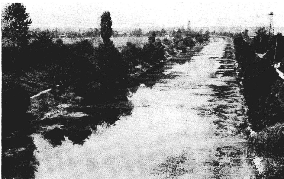
Abb. 1. Herden von Myriophyllum heterophyllum im Elster-Saale-Kanal westlich Rückmarsdorf. 7. 9. 1978