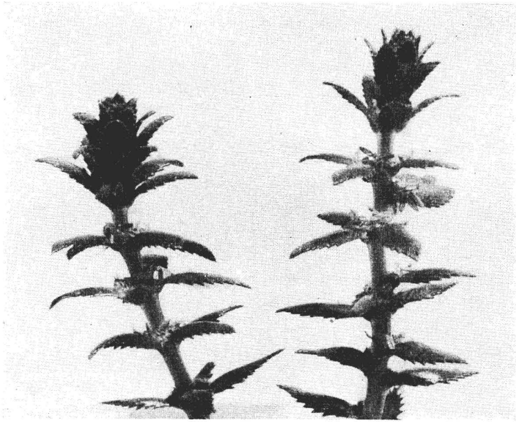
Abb. 3. Blütenähren von Myriophyllum heterophyllum mit den dicklich-derben, gezähnten bis gesägten Tragblättern. Unterste Tragblattquirle mit weiblichen Blüten (die federigen Narben sind sichtbar), obere Tragblattquirle mit männlichen Blüten (die Staubblätter sind sichtbar).

Ausdauernde, kräftige, untergetauchte Wasserpflanze mit im Grunde wurzelnden, 30–150 (250) cm langen, spärlich verzweigten Sprossen, deren fertile Spitzenteile sich über die Wasseroberfläche erheben. Tauchblätter einfach gefiedert, in meist 4- bis 5 (6)zähligen Quirlen, bis 50 mm lang, viel länger als die Internodien, mit (5) 10–20 pfriemlichen, meist wechselständigen, bis 20 mm langen Fiederzipfeln (vgl. Abb. 4). Blüten einzeln blattachselständig, zu Blütenähren zusammenstehend, die 10–15 (35) cm aufrecht über die Wasseroberfläche gehoben werden (vgl. Abb. 3); nach dem