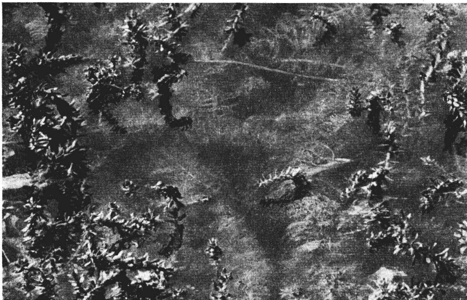
Abb. 2. Bestand von Myriophyllum heterophyllum ; außer Überwassersprossen sind auch Tauchspresse mit Tauchblättern sichtbar. 7. 9. 1978