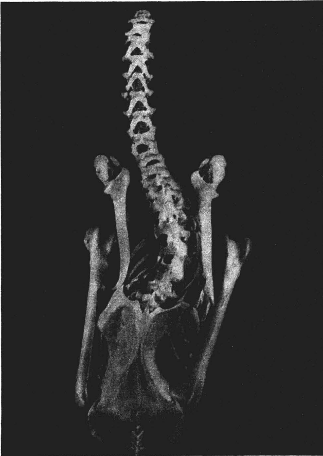
Abb. 2. Rumpfskelett von Bubo b. bubo (71/126). Asymmetrisch deformiertes Becken sowie eine S-förmige Skoliose im kaudalen Bereich der Wirbelsäule, Dorsalansicht

Das im Februar in einem Steinbruch verendet aufgefundene Weibchen (71/126) war deutlich abgemagert. Der Herzbeutel fiel durch einen weißen mehltauartigen Belag auf, die serösen Häute und die Harnleiter waren nicht befallen. Es kann sich dabei um eine Eingeweidegicht gehandelt haben. Nach Oehme (1981) treten jedoch ähnliche Erscheinungen und Nierengicht auch nach letalen Quecksilberrückstandsbelastungen auf. Bei zukünftigen Eingängen werden diesbezüglich spezielle Untersuchungen durchgeführt.