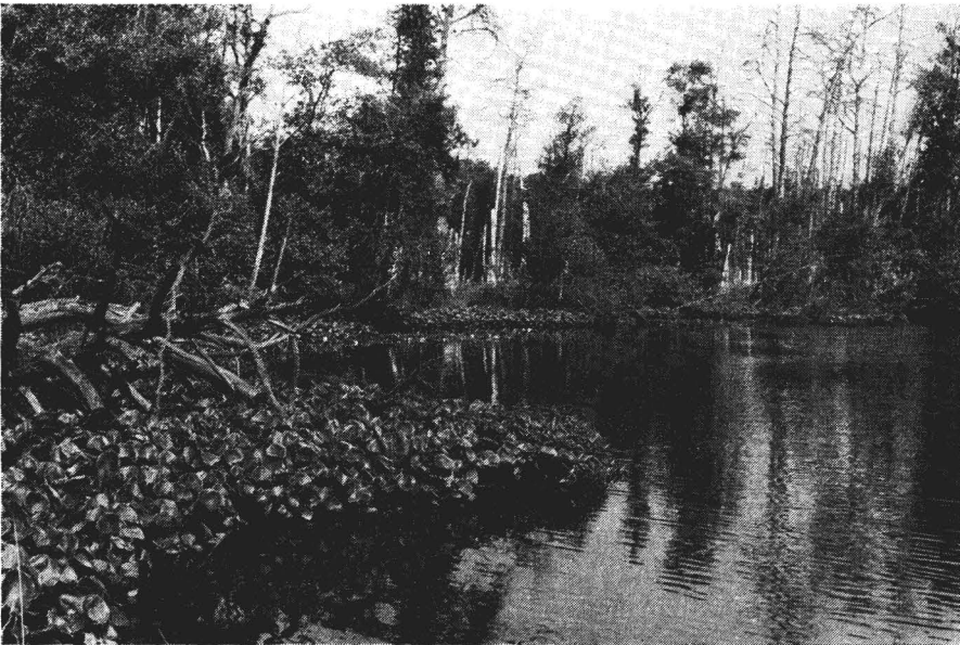
Abb. 5. Die Uferpartien des Großen Faulsees werden stellenweise beherrscht von Calla palustris , deren lange aerenchymatische Rhizome sich schwimmend weit auf die Wasseroberfläche schieben. (Foto: F. Ebel, August 1988)