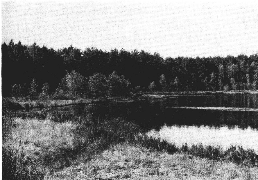
Abb. 1. Der relativ kleinflächige Möwensee wird allseitig von Schwingmoor gesäumt. Bau und Leistung des Schwingmoores werden im wesentlichen durch 6 Wuchstypen bestimmt. Besonders die mit etwa 37,7 % am Wuchstypenspektrum des Schwingmoores beteiligten Ausläuferstauden bieten ein anschauliches Beispiel für Wuchsform-Konvergenz. (Foto: F. Ebel, September 1988)

Zur Charakterisierung des Makroklimas werden für das NSG „Ostufer der Müritz“ Daten der Klimastation Waren herangezogen. Die Angaben über den Niederschlag basieren auf der Periode 1891–1930 (Reichsamt für Wetterdienst 1939), die Temperaturwerte auf dem Zeitraum 1881–1930 (Reichsamt für Wetterdienst 1939).