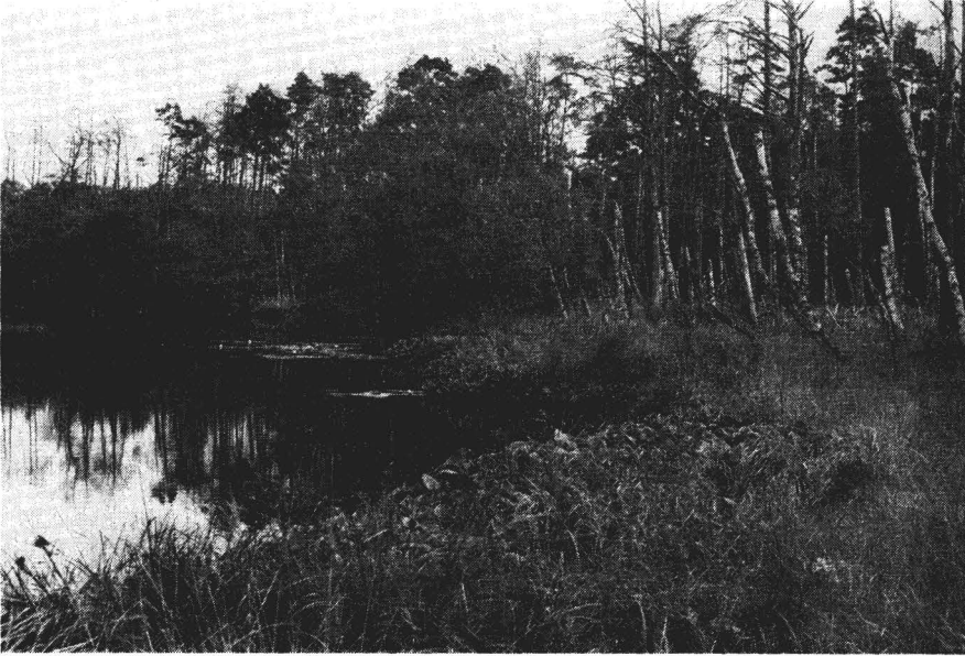
Abb. 4. Schwingmoordecke am Ufer des Großen Faulsees (Foto: F. Ebel, August 1988)