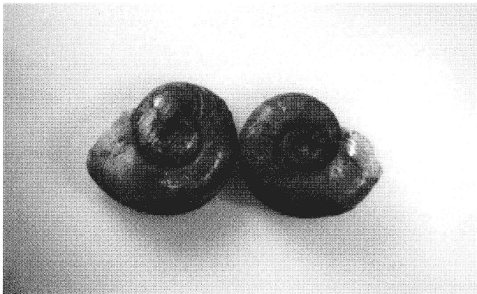
Abb. 2 Gyraulus parvula , Belegexemplare vom Muldestausee (leg. et det. G. Körnig), Zool. Sammlung der Martin-Luther-Universität

Das Artenspektrum der Molluskenfauna des Stausees läßt erkennen, daß sich in dem vorliegenden Zeitraum nahezu die gesamte Zahl an euryöken und Trivialarten der Gastropoden vom größeren Fließ-