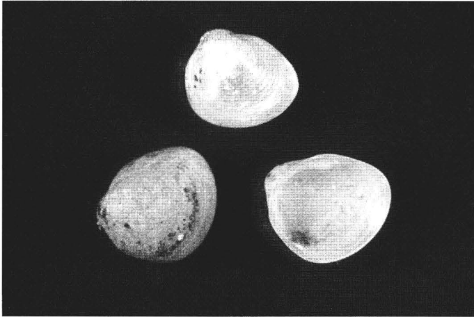
Abb. 3 Pisidium moitessierianum , Belegexemplare vom Muldestausee (det. et leg. G. Körnig), Zool. Sammlung der Martin-Luther-Universität

und Stillgewässern der Region zusammengefunden hat. Es fehlen neben den stenöken und damit selteneren Arten nur Arten der Kleinflüsse, Gräben und Tümpel. Ein Neufund für Sachsen-Anhalt ist die Adventivart Gyraulus parvus , die sich, aus Nordamerika stammend, seit 1973 verbreitet in unseren Gewässern einnisch.