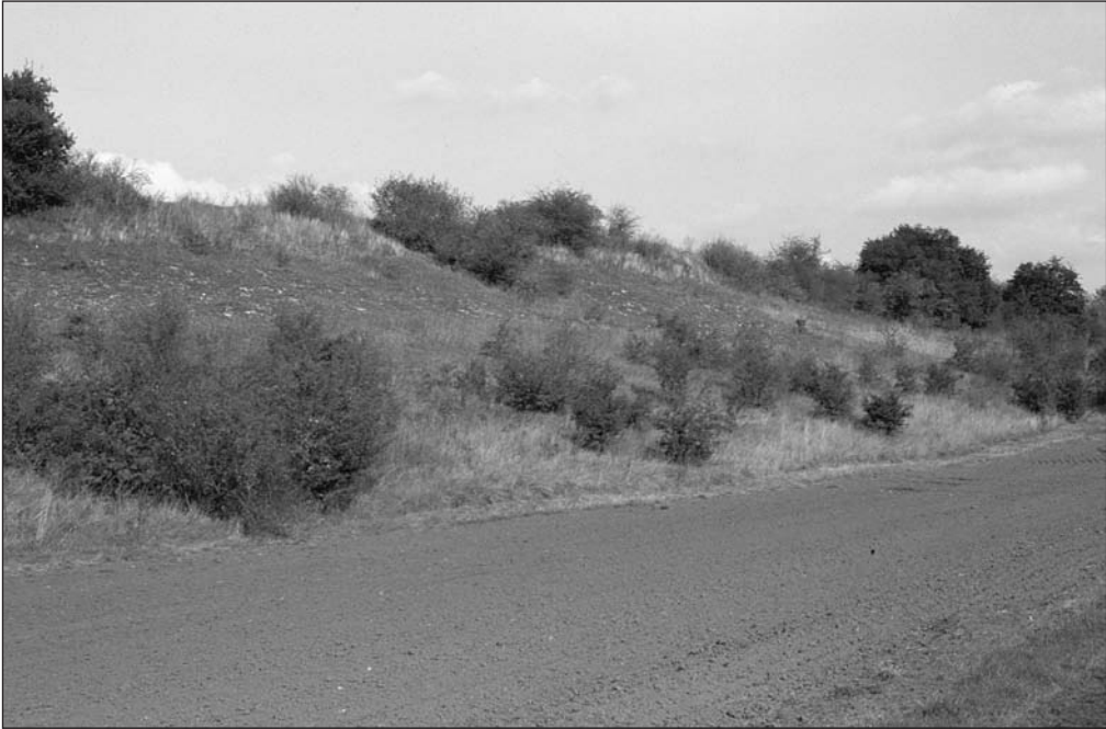
Abb. 2 Südhang des oberen Grüntals bei Krumpa mit schuttreichen Kalktrockenrasen im mittleren Hangeil und Lößanrissen entlang der Hangschulter

Malakologisch biototypisch und regelmäßig vertreten sind Truncatellina cylindrica , Cecilioides acicula , Cochlicopa lubricella , Pupilla muscorum , Vallonia pulchella , V. costata und V. excentrica sowie die Heideschnecken Helicella itala und Xerolenta obvia . Die genannten Arten sind in Sachsen-Anhalt trotz genereller Rückgangstendenz licht- und wärmeliebender Offenlandarten noch relativ weit verbreitet und können auf Xerothermrassen noch regelmäßig beobachtet werden. Auch im Grüntal sind sie regelmäßig zu finden und können als „Grundinventar“ sowohl der kurzrasigen Halbtrockenrasen als auch der verbuschten und versaumten Bestände entlang des Süd- und Nordhanges bezeichnet werden. Den Xerothermrassen des Grüntals fehlt die im nahe gelegenen Saale-Unstrut-Gebiet verbreitete Granaria frumentum . Sie erreicht in Sachsen-Anhalt die nordöstliche Verbreitungsgrenze ihres einigermaßen geschlossenen Areal. Weiter nördlich und nordöstlich befinden sich noch kleinere, in sich geschlossene, isolierte Arealinseln. Ihre Arealgrenze verläuft vom Südharz über das Gebiet des Süßen See entlang der Abbruchkante der Querfurter Platte von Schmon (NSG „Schmoner Busch, Spielberger Höhe und Elsloch“) bis Freyburg, weiter Richtung Goseck-Mertendorf-Schkölen (KÖRNIG 1966, 1981; EBEL et SCHÖNBROTH 1988; UNRUH 2001; RANA 1998, 2003 sowie zahlreiche eigene Erhebungen aus dem Saale-Unstrut-Gebiet).