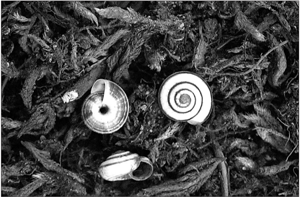
Abb. 3 Candidula unifasciata kommt in kurzrasigen, lückigen Kalkmagerrasen vor und weist bundesweit eine starke Rückgangstendenz auf

Südhang des FND innerhalb der kurzrasigen und lückigeren Bereiche zu finden. Am Nordhang fanden sich einige Schalen auf einem kleinen, schottrigen Abschnitt der Hangschulter mit Südexposition. Am zahlreichsten (hinsichtlich Leerschalen- und Lebendfunden) ist C. unifasciata auf dem L-förmigen Trockenhang im Osten des Grüntals. Trotz der z.T. starken Verbuschung findet die Art hier die besten Standortbedingungen. Der Hang weist eine relativ starke Neigung, kurze Vegetation sowie einem hohen Anteil offener Bodenstellen auf.