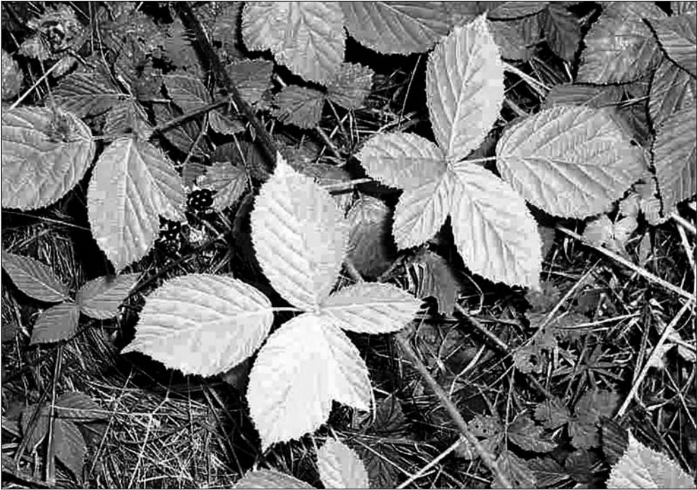
Abb. 2 Rubus dierschkeanus –Wald zwischen Almhorst und Seelze (10.8.2006)