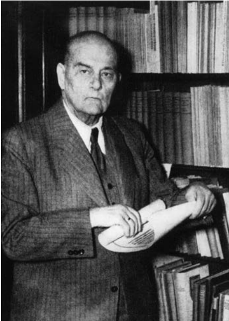
Abb. 1 Otto Schlüter, Geograph (12.11.1872–12.10.1959)