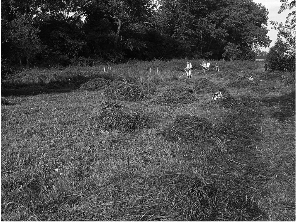
Abb. 3 Mahd der Spenderfläche am 14.08.2007