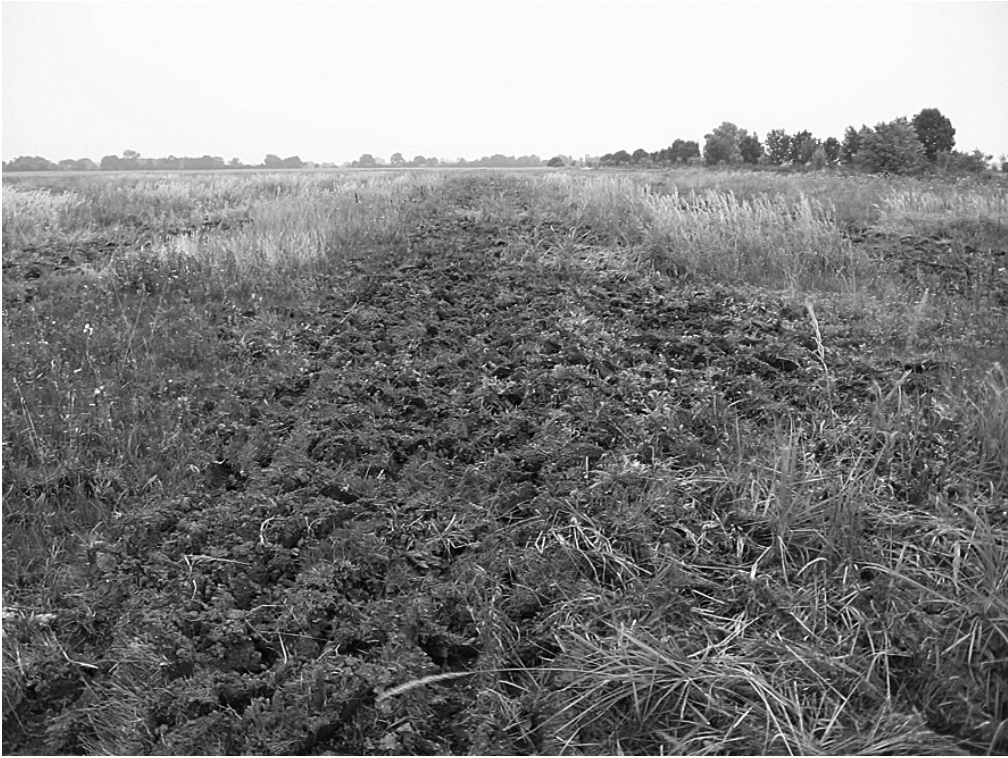
Abb. 4 Vorbehandelte Empfängerfläche am 08.08.2007; in der Bildmitte ein ca. 3 m breiter mit Scheibenpflug behandelter Streifen, beidseitig schließen sich ruderale Gras-/Krautfluren an

Fig. 4 Prepared receptor site at the 08.08.2007; in the centre a stripe of 3 m width treated with the plough, on both sides of the stripe adjacent ruderal grassland and herbaceous vegetation