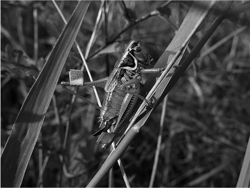
Abb. 2 Mit Reflexfolie markiertes Weibchen von Metrioptera roeselii