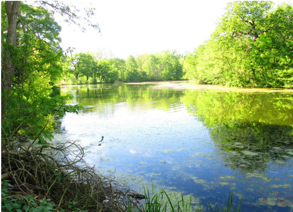
Abb. 4 Der Schloßteich Dölkau ist infolge Abwasserbelastung eutrophiert und stark verschlammmt.