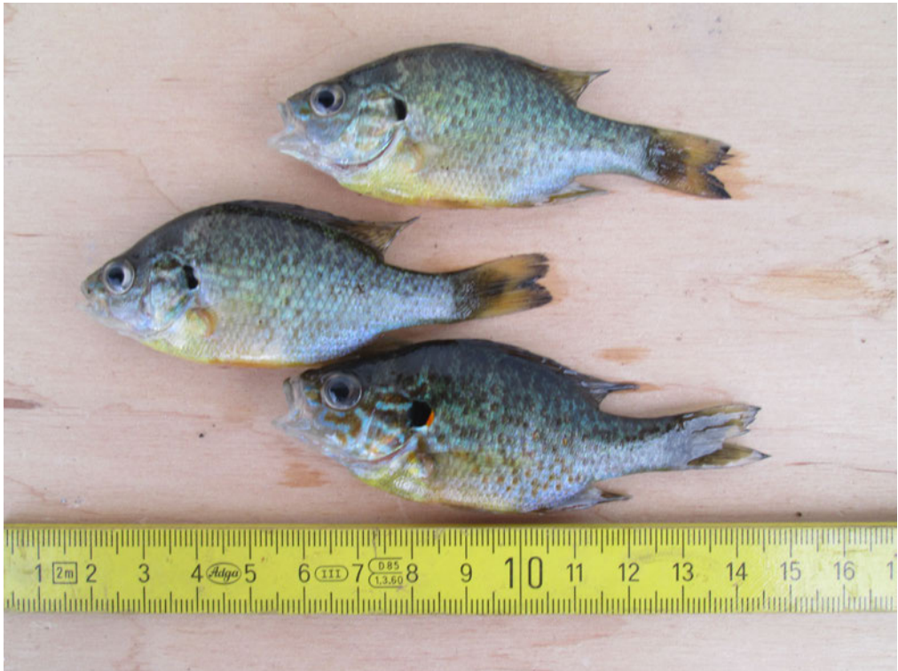
Abb. 6 Ein ♂ (TL 90 mm) (unten) und zwei ♀♀ (TL 85 mm) aus dem Bagger Thekla (wenigen Minuten vor der Fotoaufnahme vermutlich erstickte Fische).