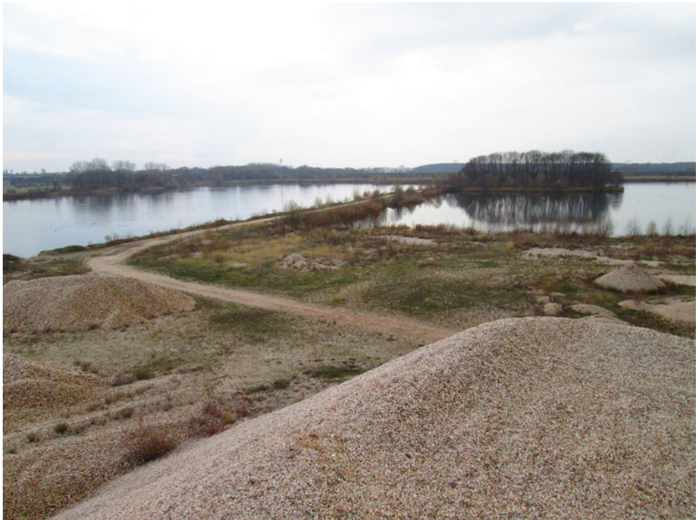
Abb. 3 Die nördliche (im Bild rechte) und die südliche (linke) Kiesgrube bei Kleinliebenau sind nur durch einen rund 15 m breiten, beim Kiesabbau stehen gelassenen Damm getrennt.

Sichtbeobachtung am 26.08.2018 von zwei Adulti.