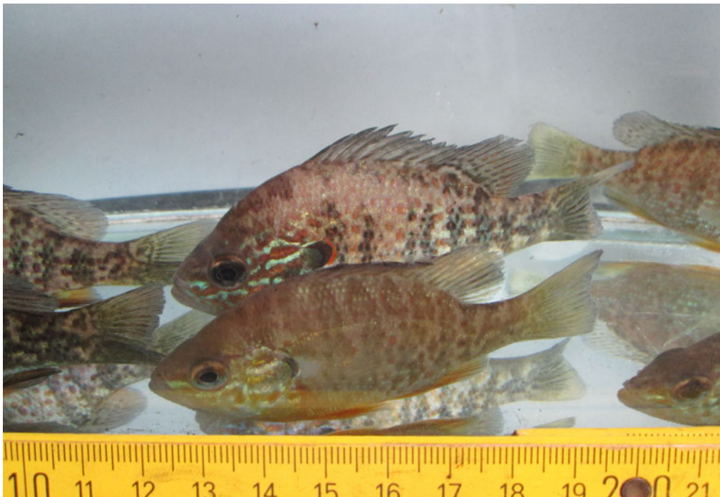
Abb. 2 Männchen (oben) und Weibchen (unten) aus dem Bagger Thekla am Ende der Laichzeit.

Eine weitere Probe von fünf ♂♂ und sechs ♀♀ wurde ein Jahr später am 23.08.2018 entnommen. Diese um ein Jahr älteren Fische waren im Vergleich mit der 2017 entnommenen Probe ohne Unterscheidung der Geschlechter mit durchschnittlich 96,6 mm (Stabw 2,91) um 20,4 mm länger. Die Männchen waren mit 90 bis 113 mm, im Mittel 104,4 mm (Stabw 8,73), deutlich größer als die nur 85 bis 96 mm, im Mittel 90,2 mm (Stabw 4,62), langen Weibchen.