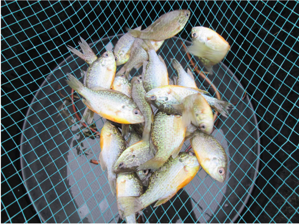
Abb. 5 Zwei bis drei Jahre alte Sonnenbarsche aus dem Bagger Thekla in Leipzig.