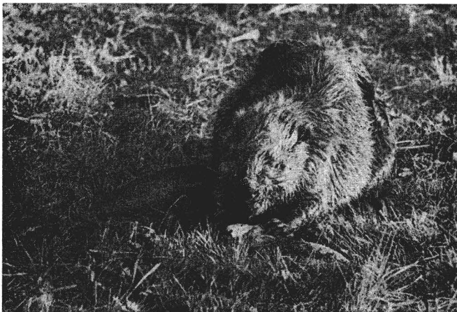
Abb. 2. Stark abgekommener, seniler Elbebiber, vor allem an den sich im Kellenbereich deutlich abzeichnenden Schwanzwirbeln zu erkennen

Der Schwanz dient ferner als Vorratsdepot für Reservefett. Aleksiuik (1970) stellte fest, daß die Fettprozentage im Schwanzgewebe in regulärer Weise markant fluktuieren. Der Fettanteil ist im Frühjahr niedrig, steigt während der Sommer- und Herbstmonate stark an und erreicht das Maximum im zeitigen Winter. Bis zum Frühjahr sinkt der Fettanteil dann wieder entsprechend ab. Im gleichen Zyklus steigt und fällt das