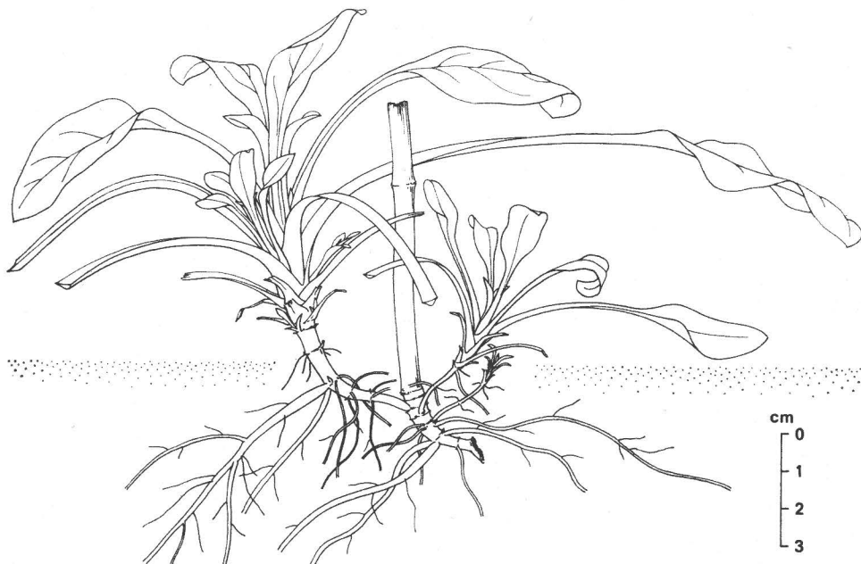
Abb. 2. Silene dioica . Selbständig gewordene Teilpflanze mit abgestorbenem Blüentrieb im Winterzustand (Januar; Auwald bei Halle)

Die Differenzierung im Wurzelbereich der in Abb. 1 dargestellten Pflanzen hat eine gewisse Entsprechung bei den oberirdischen Teilen. S. alba mit ihrer reichen distalen Verzweigung der Blüentriebe steht im Gegensatz zu S. dioica , die am stärksten im basalen Bereich verzweigt ist. Ihre Blütezeit beschränkt sich bei uns auf den