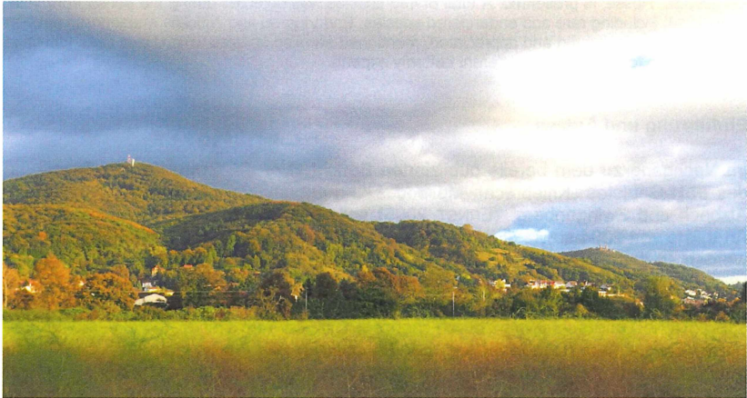
Abb. 2: Ausschnitt aus dem südlichen Teil des FFH-Gebietes mit dem 517 m hohen Melibocus, der Orbishöhe bei Zwingenberg (Bildmitte) und dem Auerbacher Schloss am Bildrand rechts

Das FFH-Gebiet wird im Norden von der K 143 zwischen Seeheim und Ober-Beerbach und im Süden von der L 3103 zwischen Bensheim und Hochstädten begrenzt. Die Westgrenze am Bergstraßenrand folgt im Wesentlichen der Wald-Offenland Gren-