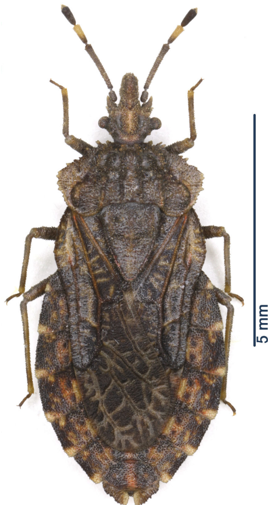
Abb. 1: Aradus ribauti E.WAGNER aus der Ginsheimer Rheinaue