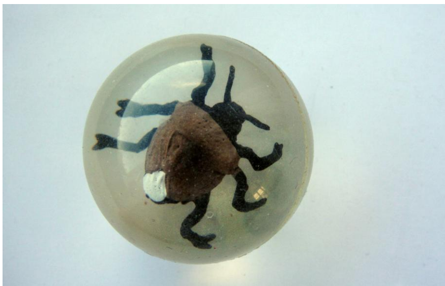
Wanze in „Aspik“ (oder im „Flummi“ / Springball) leg. GREGOR TYMANN