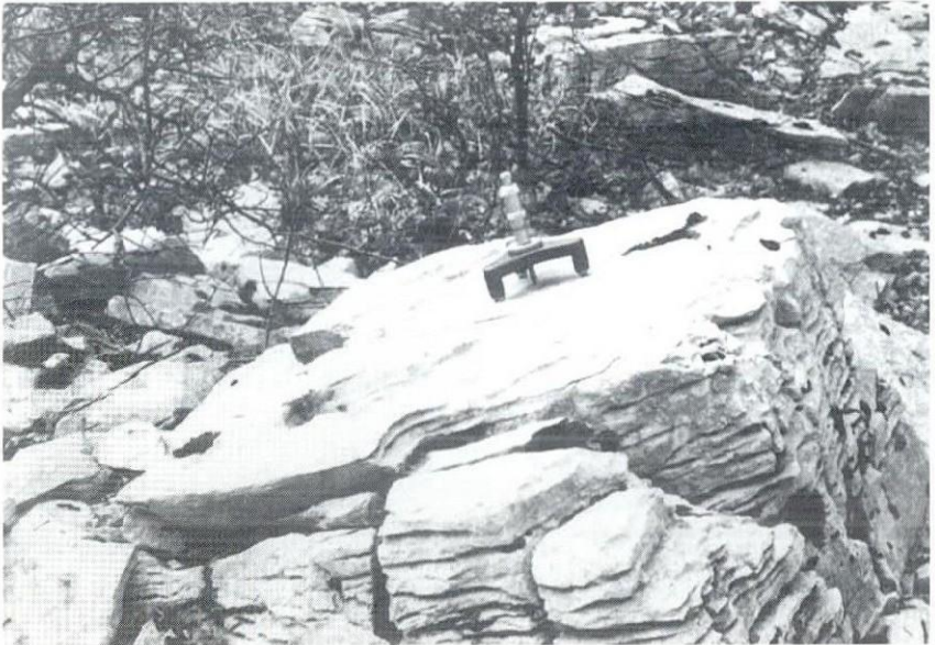
Abb. 2: Meßstation CN im Triestiner Karst.

Es ist sicher, daß diese Daten nicht ausreichen, um endgültige Schlüsse über die Korrosion im Karst zu ziehen. Sie bilden eine Aussage über den momentanen Zustand, und es wird äußerst wichtig sein, solche Meßstationen auch