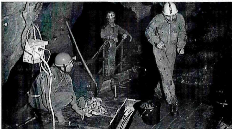
Abb. 5: Arbeiten von Mitarbeitern in der Höhle: Erneuerung der Plattform unter dem „Niagarafall“, einer bedeutenden Sinterbildung.

ganges der Fledermauspopulation, überwintern 400 bis 500 Tiere in der Höhle. Meist gehören sie zur Art der „Kleinen Hufeisennahe“. Daneben sieht man immer wieder auch „Große Mausohren“; insgesamt wurden schon 15 verschiedene Fledermausarten beobachtet. Die Fledermäuse sind eine besondere Attraktion für die Besucher; die echten Höhlentiere, die in der Höhle vorkommen, wie der Doppelschwanz der Gattung Plusiocampa , die Gliederfüßer Neobisium hermanni und Onychiuris arminiarius und das im Teich lebende Grundwassertier Bathynella natans sind zoologisch interessant, aber unscheinbar, da nur 1-2 mm groß. In den letzten beiden Jahrzehnten war die Höhle das Studienobjekt von Untersuchungen, die vom Botanischen und vom Meteorologischen Institut der Universität Wien ausgingen; darüber hinaus regte der die Höhle betreuende Verein Untersuchungen und Beobachtungen durch Fachleute auf dem Gebiet der speleologischen Forschung vorwiegend vom Naturhistorischen Museum Wien an. Die Ergebnisse dieser Arbeiten wurden zusammen mit einem ausführlichen geschichtlichen Über-