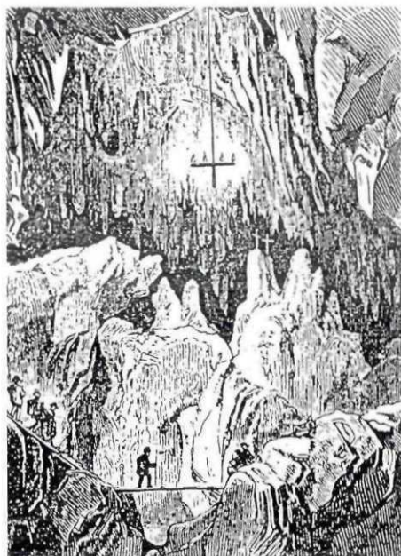
Abb. 2: Holzschnitt aus dem 1869 erschienen „Kundigen Begleiter in der Hermannshöhle“. Die Darstellung hat mit der tatsächlichen Situation in der Höhle wenig gemeinsam.

dung ist offensichtlich in mehreren Stadien erfolgt, die möglicherweise mit den Senkungsperioden des Kirchberger Beckens in Zusammenhang gebracht werden können. Im wesentlichen lassen sich zwei Hauptetagen von Höhlengängen erkennen: vom Taubenloch, das 670 m hoch liegt, ziehen sich größere Hallen und Gänge in die Tiefe, deren meist aus Feinsedimenten gebildeter Boden in 650 m Höhe liegt. Von hier führen einige Abgründe ins Niveau des unteren Einganges (627 m) und von diesem ausgehend vielfach verzweigte, meist enge Schluf- und Canyonstrecken bis zu den tiefsten Punkten in 609 m bzw. 606 m Seehöhe. Der Grundriß des gesamten Systems zeigt eine labyrinthartige Entwicklung auf einer Grundfläche von lediglich 142 m (O-W) x 160 m (N-S), in dem heute 4.430 m Gänge mit 73 m Höhenunterschied vermessen sind. Zwar wurde der erste Höhlenplan schon im Jahre 1869 zusammen