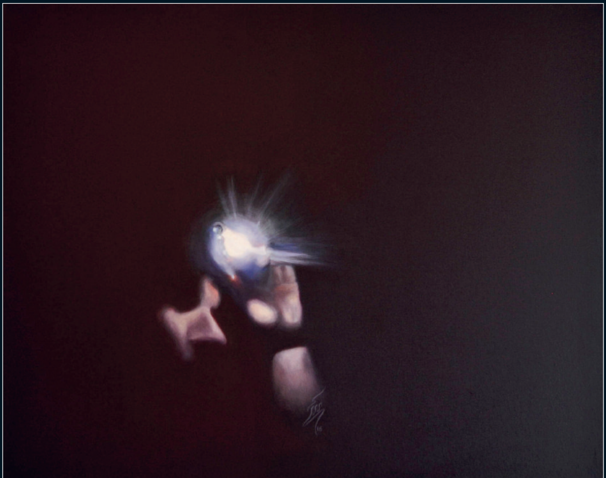
6a & 6b: Darkness / Diptychon (2016) – awarded, Technique: Acrylic on canvas. Size: 100 cm x 80 cm (each).