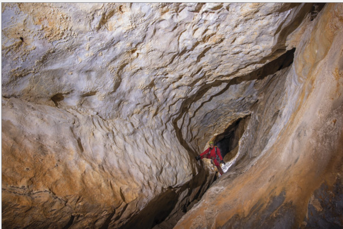
Abb. 2: Passage in der Cueva de las Tres Entradas Más Una. Fig. 2: Passage in Cueva de las Tres Entradas Más Una.