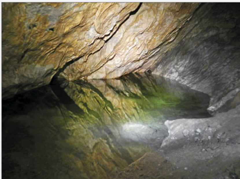
Abb. 5: Großer See im Scheukofen.

aus dem Schlauch eines Fahrrades, den gesamten Siphon durchtauchen könnten. Das Führungsseil war so bemessen, dass es lediglich eine Tauchstrecke von 12 Metern zuließ. Trotz seiner Jugend war Friedl dank seiner fülligeren Figur der bessere Schwimmer und Taucher, und so sollte er den ersten Vorstoß in die unbekannte Tiefe wagen, während ich ihn am Eingang des wassererfüllten Ganges mit dem Seil sicherte und ihn mit dem Licht meiner Lampe den Rückweg wies. Als Friedl in der dunklen Tiefe verschwunden war, begann ich laut zu zählen, denn nach spätestens 30 Sekunden sollte ich ihn mit dem Seil zurückholen. Bereits einige Sekunden vor Zeitablauf zog ich am Seil und fühlte statt des weichen Widerstandes eines lebenden Körpers eine harte Sperre, welche ein Verhaken des Seiles an einer Felszacke vermuten ließ. Nach einigen hastigen