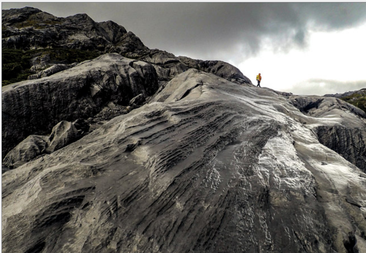
Abb. 1: Einer der „Marmor-Gletscher“ der Isla Madre de Dios. Fig. 1: One of the „marble glaciers“ of Isla Madre de Dios.