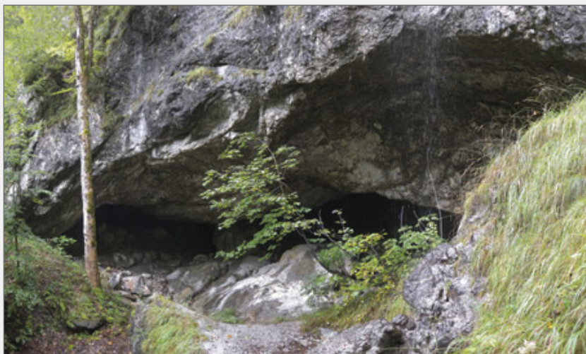
Abb. 4: Portal des Scheukofens.