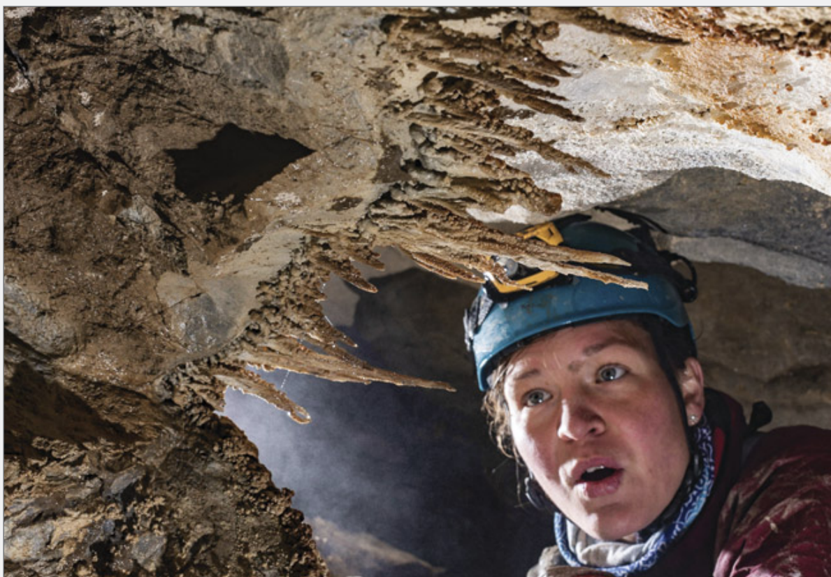
Abb.3: Horizontale Stalaktiten in der Cueva de Punta Blanca. Fig. 3: Horizontal stalactites in Cueva de Punta Blanca.