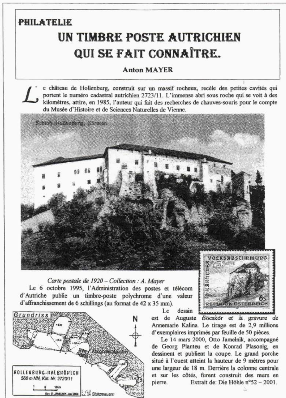
Abb.1: Auszug aus einer belgischen Philatelisten-Zeitung