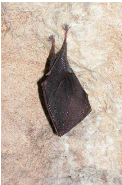
Kleine Hufeisennase, Rassel-System 2003