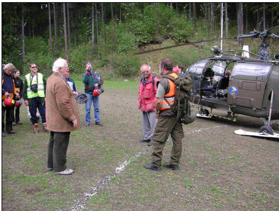
Kärntner Höhlenrettungsübung 2005

Bei der Kärntner Höhlenrettungsübung am 6.5.2005 im Gebiet Hochobir wurde erstmalig mit einem Hubschrauber vom Österreichischen Bundesheer geübt. Die Übung wurde von der Einsatzstelle Klagenfurt organisiert und veranstaltet. Da wir mit dieser Übung Neuland für die Retter betraten, gab es vorher zwei theoretische Schulungsabende. Der erste Teil der Schulung wurde im Rahmen einer Fachgruppenezusammenkunft abgehalten, der zweite Teil fand am Hubschrauberstützpunkt Klagenfurt direkt am Gerät statt. Bestens geschult wurde dann bei der Übung das Erlernte umgesetzt. Die Übungsannahme war die Bergung eines Verletzten am Hochobir aus einem Stollen. Personen und Materialtransport mit dem Hubschrauber zum Unfallort und retour. Anschließend an die Übung fand die Nachbesprechung in der Kantine des Sportplatzes von Bad Eisenkappel statt. Der Sportplatz eignete sich ideal als Start- und Landeplatz für den Hubschrauber. Es gilt ja auch praktische Erkenntnisse aus den Übungen zu ziehen und wir haben somit einen geeigneten Start- und Landeplatz für den Ernstfall gefunden. Insgesamt haben 24 Personen an dieser Übung teilgenommen.