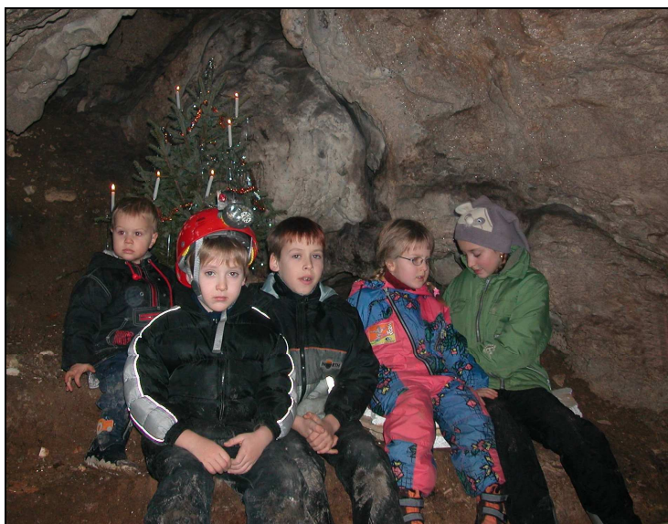
Höhlenweihnachtsfeier 2004 Deutschmannlucke Bad Eisenkappel

Studenten der Universität Klagenfurt, Sparte Kommunikations- und Medientechnik, hatten sich als Projekt die Erstellung einer DVD über die Obir-Schauhöhle vorgenommen. Nach der Fertigstellung sollte die DVD dann von der Obir-Schauhöhle als Souvenir zum Verkauf angeboten werden. Die Fachgruppe unterstützte das Projektteam bei den Aufnahmen in den nicht öffentlich zugänglichen Naturhöhlenteilen am 12.11.2004 und stand auch für Interviews zur Verfügung.