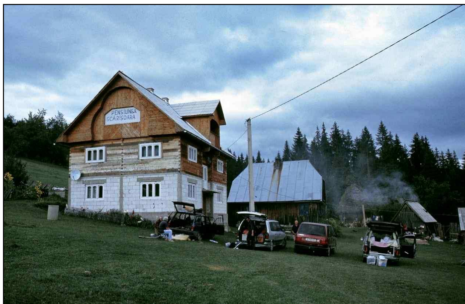
Pension Șarișoara, eines unserer Quartiere während der Rumänien Exkursion 2005

Laut Programm war der Besuch der längsten Höhle Rumäniens, der Vintului-Peștera (Wind-Höhle) geplant. Quasi am vorbeigehen besuchten wir noch eine Schauhöhle in der Nähe, die Unguru Mare Peștera (Ungarische Höhle). Nachdem wir zwei Tage in der Jugendherberge verbracht hatten, brachen wir unsere Zelte ab und fuhren über Oradea und Bejuș nach Chiscău. Dort war der Besuch der Urșilor-Peștera (Bären-Höhle), einer weiteren Schauhöhle, geplant. Diese Höhle befindet sich geologisch in einem Marmorblock und man findet darin einige versinterte Bärenknochen. Eine wunderschöne Höhle mit schneeweißen Versinterungen.