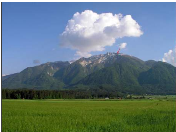
Abb. 3: Petzen von Süden – Der rote Pfeil markiert die Lage der Höhlen.