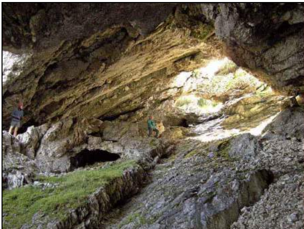
Abb. 7: Petzertor – unterer Bereich mit abendlichem Lichteinfall