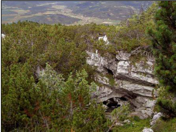
Abb. 5: Der obere Eingang des Petzertores liegt unscheinbar im Latschengestrüpp.