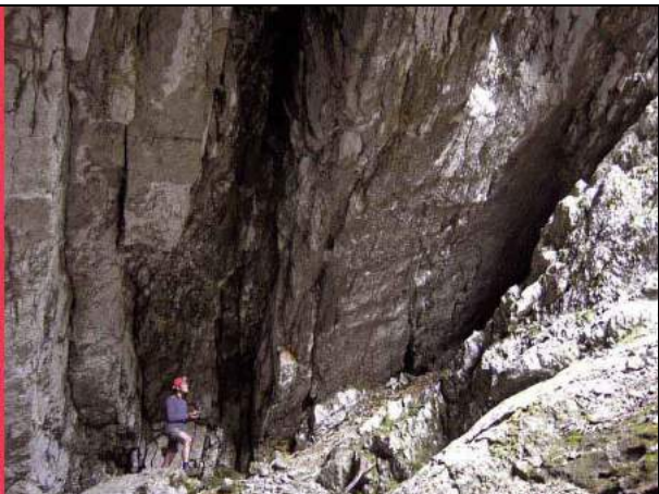
Abb. 8: Petzertor – senkrecht verkipptes Schichtpaket