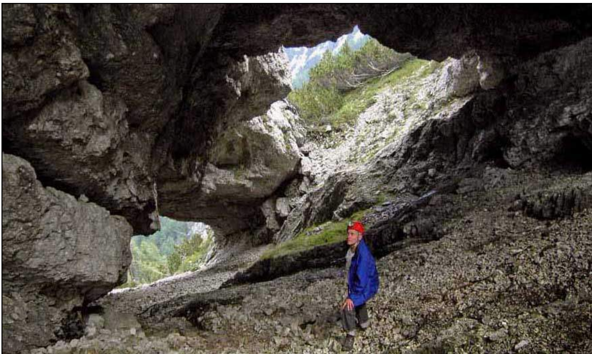
Abb. 9: Petzertor – Blick zu den unteren Ausgängen