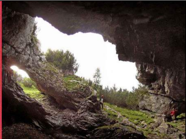
Abb. 6: Petzertor - Blick aus der Haupthalle zu den oberen Eingängen