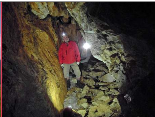
Abb. 4: Eisloch