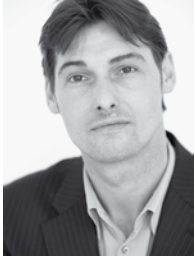
Herbert Hirner Agentur für Kommunikation