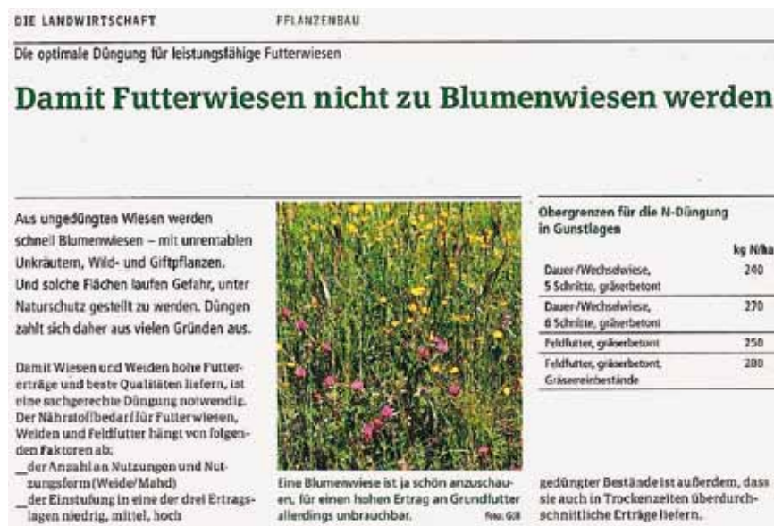
Auszug aus dem Artikel von DI Hans Humer in „Die Landwirtschaft“.

Nach einigen Recherchen und Gesprächen mit Vertretern der Oö. Landwirtschaftskammer sollten wir beruhigt davon ausgehen, dass in Oberösterreich die Uhren anders gehen. Guter Ertrag auf Futterwiesen liegt im Interesse jeder Bäuerin und jedes Bauern – dass sich unter der bäuerlichen Bevölkerung aber niemand mehr findet, der auch den ökologischen Wert einer Blumenwiese schätzt, wäre dennoch ein Märchen. Denn ca. 3.000 bäuerliche Betriebe in Oberösterreich beziehen Gelder aus der Maßnahme WF des ÖPUL und des Pflegeausgleichs für ökologisch hochwertige Flächen, die insbesondere der Erhaltung unserer letzten Blumenwiesen dienen. Etwa 5.000 ha Blumenwie-