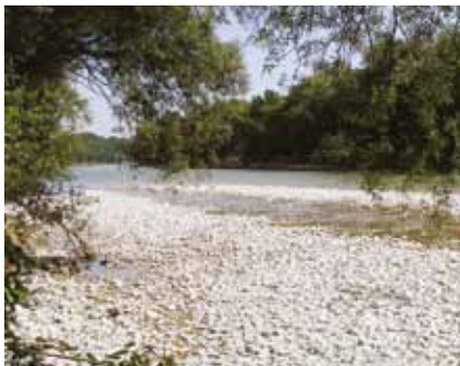
Traun bei Steinhaus.

Maßnahmen, die einzeln oder im Zusammenwirken mit anderen Maßnahmen zu einer wesentlichen Be-