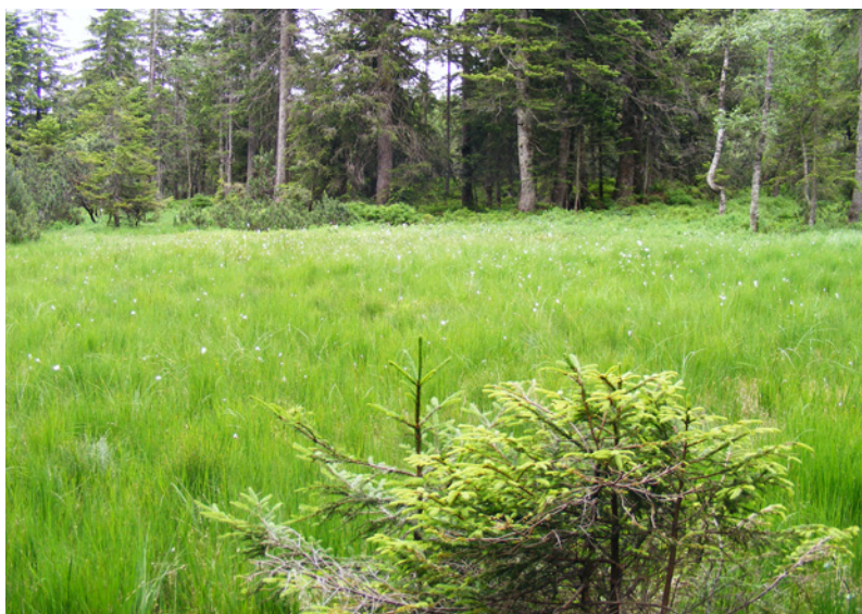
Abb. 1: Lebendes Hochmoor im Randmoos (FFH 7110, Fläche B)

Zusätzlich wurden nicht FFH-relevante Standorte beprobt: Ein feuchter Laubmischwald am Losenbach im südlichen Teil und die Ufervegetation am Rothenbachufer im nördlichen Teil des Untersuchungsgebietes.