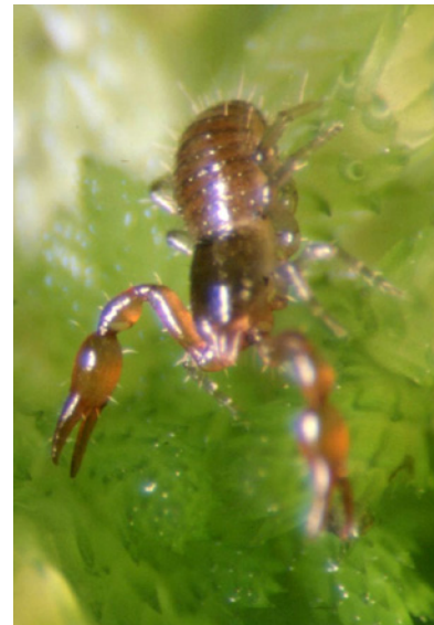
Abb. 6: Microbisium brevifemoratum .

Erstnachweis für Vorarlberg. Mittel-, Süd-, West- und Osteuropa (HARVEY