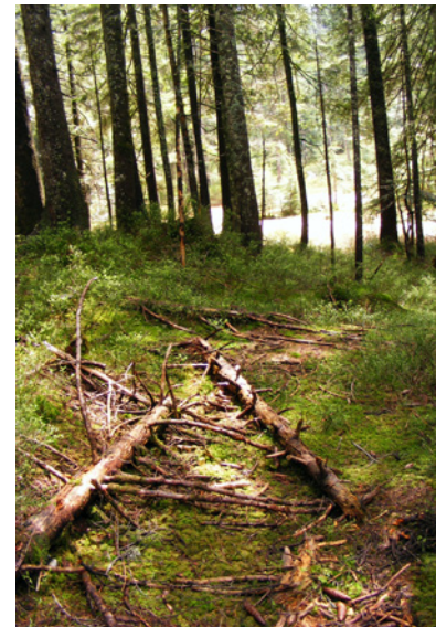
Abb. 3: Bodensaurer Fichtenwald (FFH 9410) südlich des Randmooses