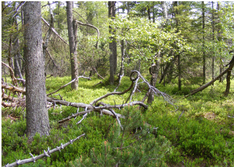
Abb. 2: Fichten-Moorwald (FFH 91D4) nahe dem Lebendem Hochmoor (FFH 7110, Fläche A)