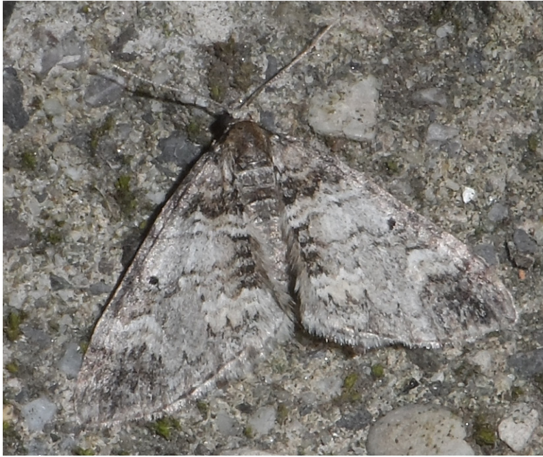
Abb. 3: Ebenfalls vom Furkajoch stammt das erste durch Genitaluntersuchung bestätigte Exemplar von Perizoma juracolaria

ma obsoletata ist somit zweifelhaft. Die potentiell weite Verbreitung von Perizoma juracolaria in den südlichen Alpen wird schließlich durch einen genitaluntersuchten Beleg aus Friaul untermauert, der auch ein Vorkommen im südlichen Österreich möglich erscheinen lässt.