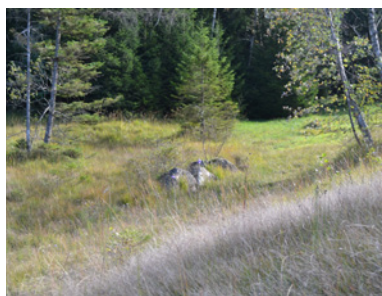
Lebensraum 4: Ebnerberg

Der Ebnerberg bietet eine reizvolle Palette von Kalkniedermooren, welche als Streuwiesen genutzt werden. Diese haben oft auch bultige Strukturen. Kleine Rinnsale bzw. Quellbäche durchziehen das Hangmoor und entwässern das Ried. An regenreichen Tagen tritt das Wasser teilweise auch flächig aus.