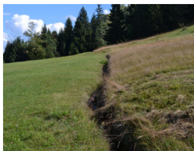
Lebensraum 2: Graben beim Wißerstall

Oberhalb der Straße gibt es einen schmalen, von Feuchtwiesen umgebenen Quellbach. Der Graben ist das ganze Jahr wasserführend, die Wände