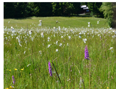
Lebensraum 8: Streuwiese bei Grava

Eine großflächige offene Riedwiese mit artenreicher Vegetation. Auch hier finden sich mehrere kleinere Rinnsale mit Entwässerungsgräben, aber kaum Bulte.