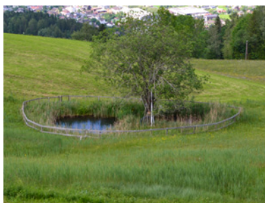
Lebensraum 1: Weiher im Bereich Stutz

Es handelt sich um einen kleinen, circa 15 m 2 großen, künstlich angelegten Weiher mit ständiger Frischwasserzufuhr. Das Gewässer wird von einem Schilfgürtel umgeben und ist durch einen Zaun scharf abgegrenzt. Ein schmaler Graben leitet das Wasser ab. In weiterer Umgebung befindet sich eine Feuchtwiese.