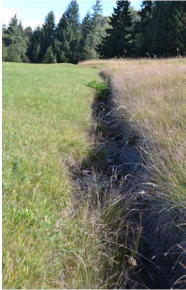
Typischer Lebensraum und Fortpflanzungsraum der Gestreiften Quelljungfer, der Graben beim Wißerstall – Aufnahme im Frühling 2015.

bende Vegetation (Intensivierung der Landwirtschaft, Entwässerungen etc.) lassen diese Lebensräume vielfach unbemerkt verschwinden.