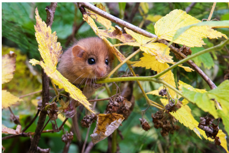
Abb. 1: Die Haselmaus ( Muscardinus avellanarius ) (Foto: Naturpark Nagelfluhkette).

Systematisch wird die Art in der Familie der Gliridae Muirhaed, 1819 (Schläfer oder Bilche) geführt. Mit einer Kopf-Rumpf-Länge von 65-90 mm und einem Gewicht von 15-40 g ist Muscardinus avellanarius der kleinste