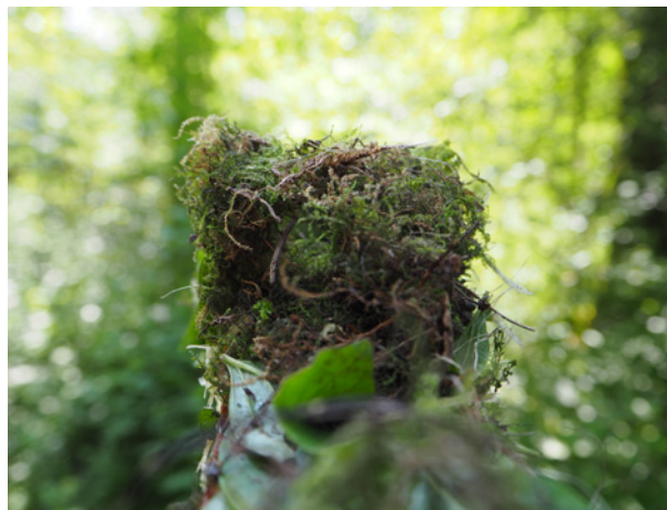
Abb. 3: Das Nest der Haselmaus in der Niströhre.