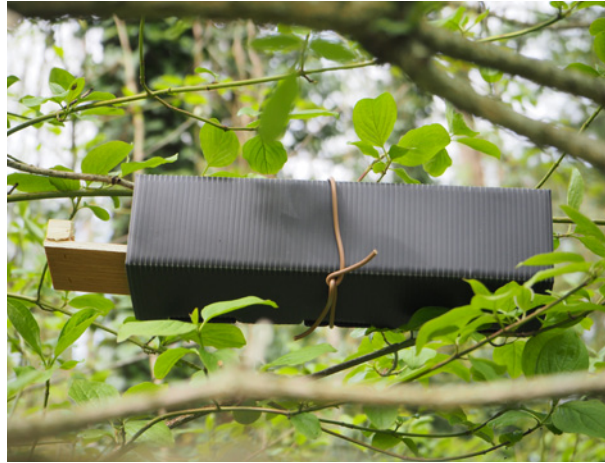
Abb. 2: Niströhren (Fotos: J. Klarica).